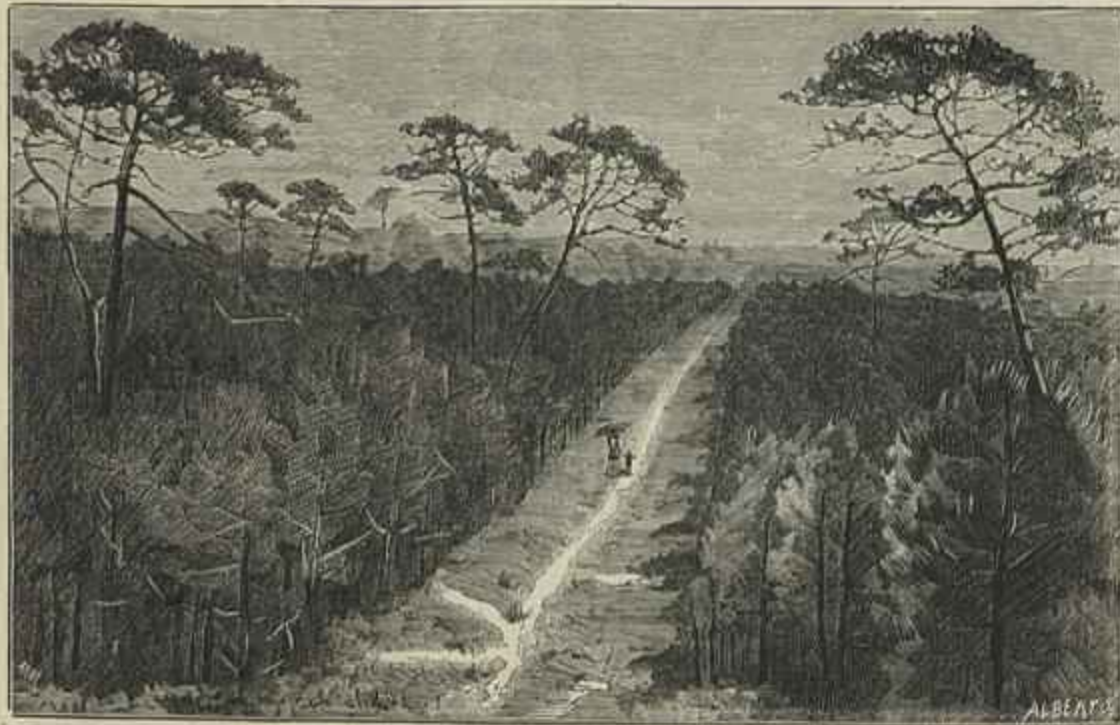
UM ACEIRO (segundo uma photographia de Ferreira de Loureiro)

(Segundo uma photographia de Ferreira de Loureiro)