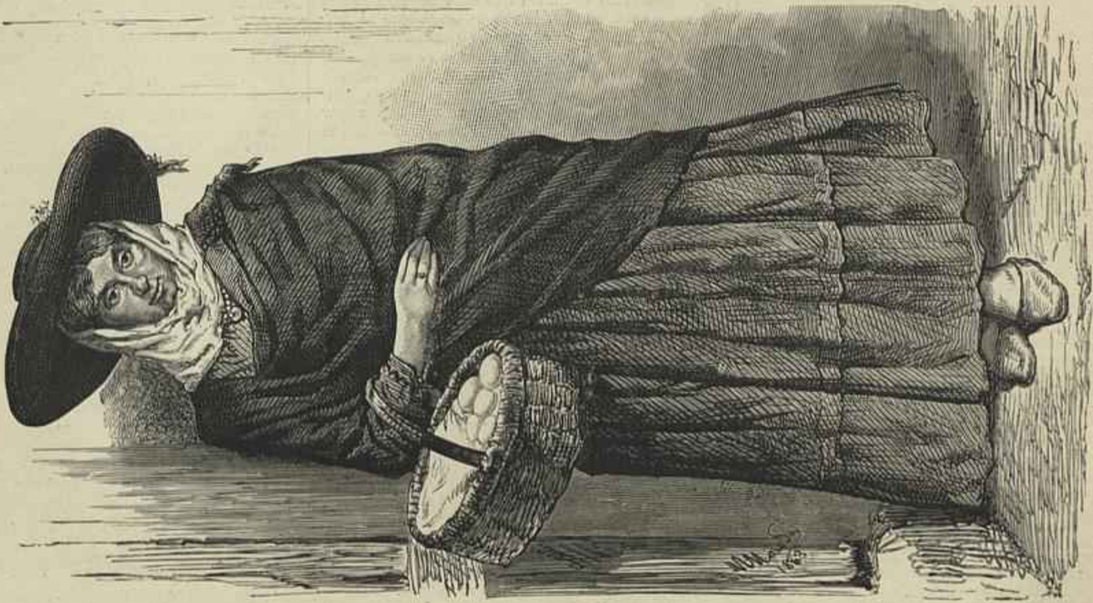
ALDEA DAS MARGENS DO MONDEGO (Desenho do natural por M. Macedo)