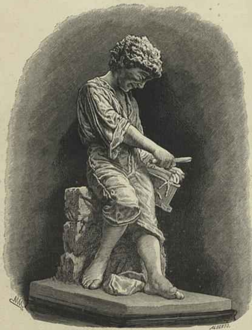
RAPAZ RUFANDO N'UMA PANELLA