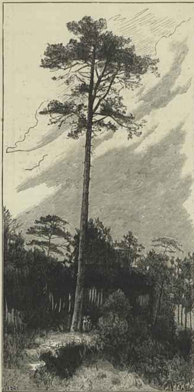
OS PINHEIROS EM PORTUGAL — ARVORE SECULAR

Lord Byron em Portugal é o livro de mais curiosa investigação que nos ultimos tempos tem sahido dos prelos portuguezes. O auctor acompanha o celebre poeta inglez na sua celebrada excursão pelo nosso paiz, fazendo reviver os personagens e os costumes da epocha em que o auctor do Child Harold visitou Portugal, epocha que sem ser muito recuada nem por isso deixa de ser mais ignorada do nosso tempo, do que talvez o primeiro periodo da monarchia.