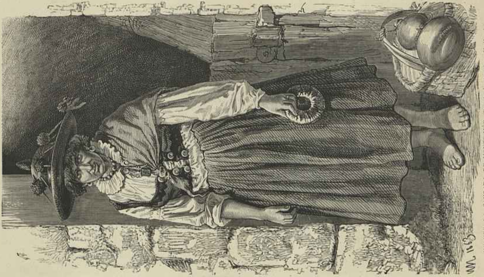
MULHER DA GANDARA DE MONTE-MOR (Desenho do natural por M. Macedo)