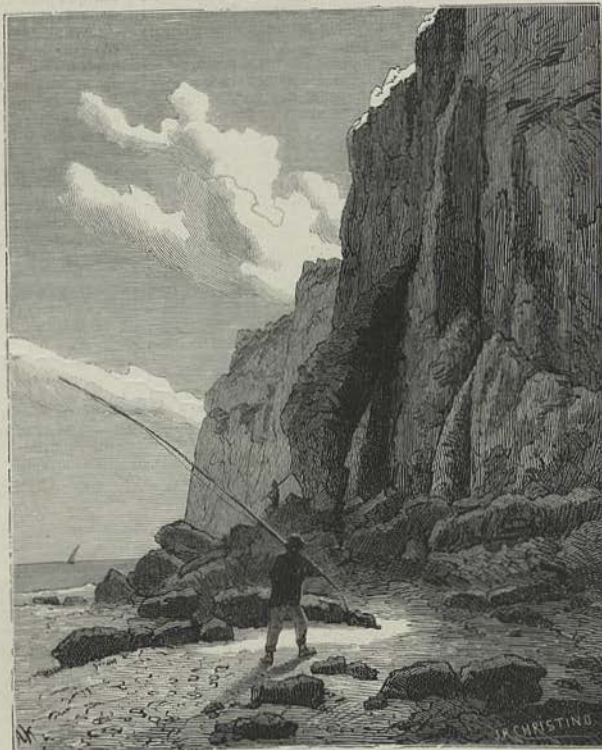
CABO DE ESPICHEL — A BALIEIRA (Desenho do natural por Alfredo Kell)

A particularidade de se não encontrar em Sabroso o minimo vestigio d'influencia romana não deixa duvida de que estamos em