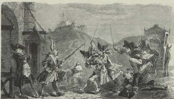
QUE EM SEGURO JÁ POSTO, AO PÉ DA GUARDA,