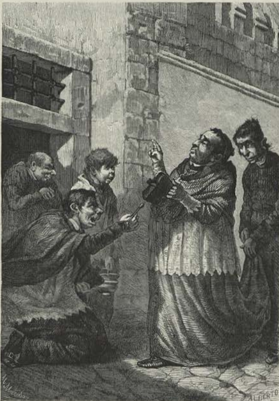
AO PASTOR QUE SE APEIA O HYSOPE OFFERECE

Gravuras extrahidas do Hyssope , poema heroe-comico de Antonio Diniz da Cruz e Silva, edição da empresa do Archivo Pileosco