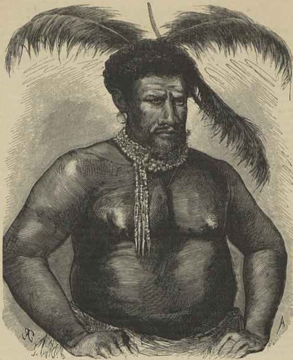
KETCHUAYO, REI DOS ZULUS (Segundo um desenho do viajante Eduard Tilt.)

— Viuva do nosso primeiro eleito, do nosso primeiro prato. Casou com ella, e ainda vive, feliz, respeitado e prospero. Ah! senhor, aquillo foi uma especie de novella, de romance. Aqui é onde eu fico, senhor; tenho de lhe dizer adens. Se alguma vez lhe appetecer, venha estar comigo dois ou tres dias, estimarei tel-o na minha companhia. Gosto do senhor. Sympathizei comsigo. Parece-me que podia gostar