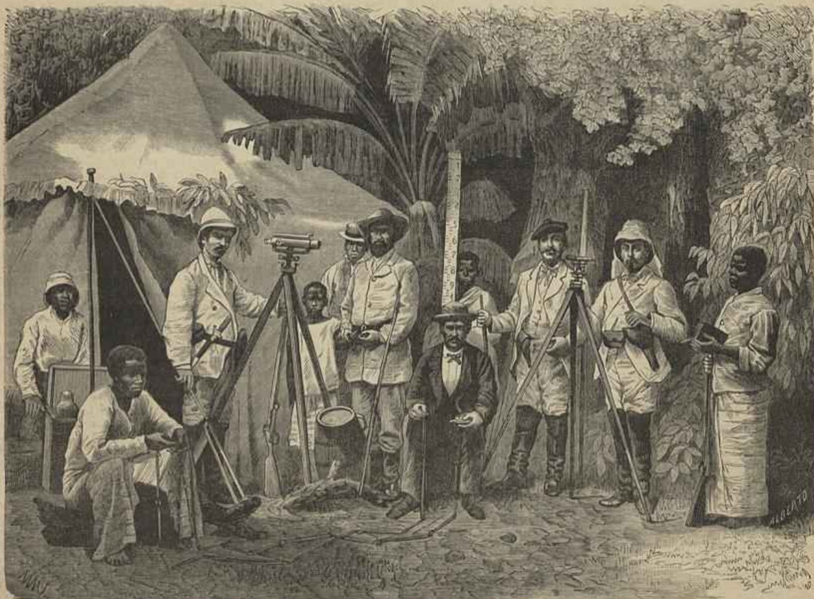
EXPEDIÇÃO DE OBRAS PUBLICAS DE ANGOLA