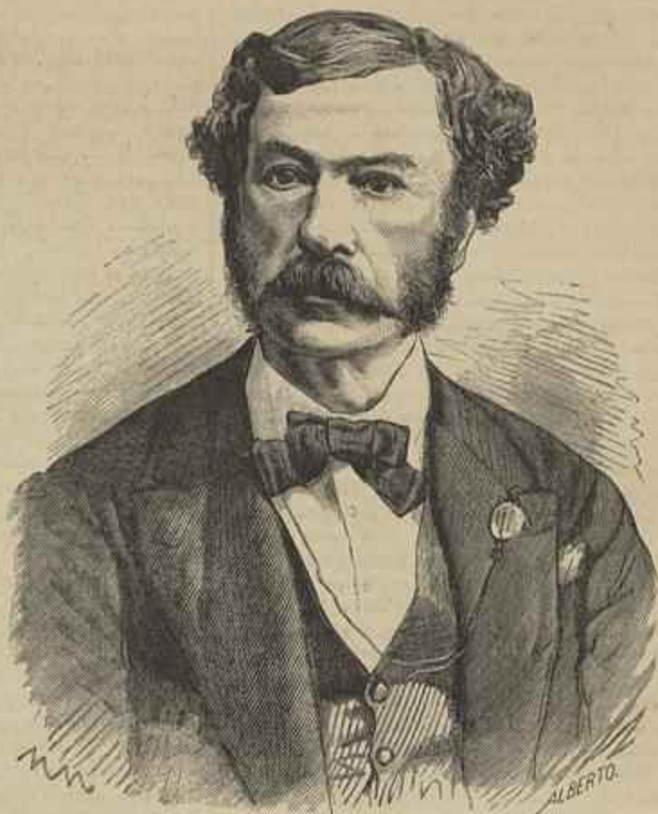
JOSÉ FELICIANO DE CASTILHO (Fallecido em 11 de fevereiro de 1879)