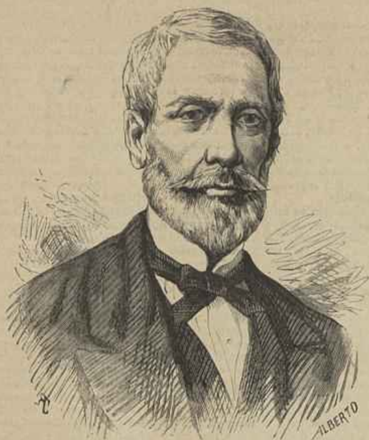
VISCONDE DE SANTA THEREZA, GENERAL POLIDORO (BRAZILEIRO) (Fallecido em 13 de janeiro de 1872 — Segundo uma photographia)