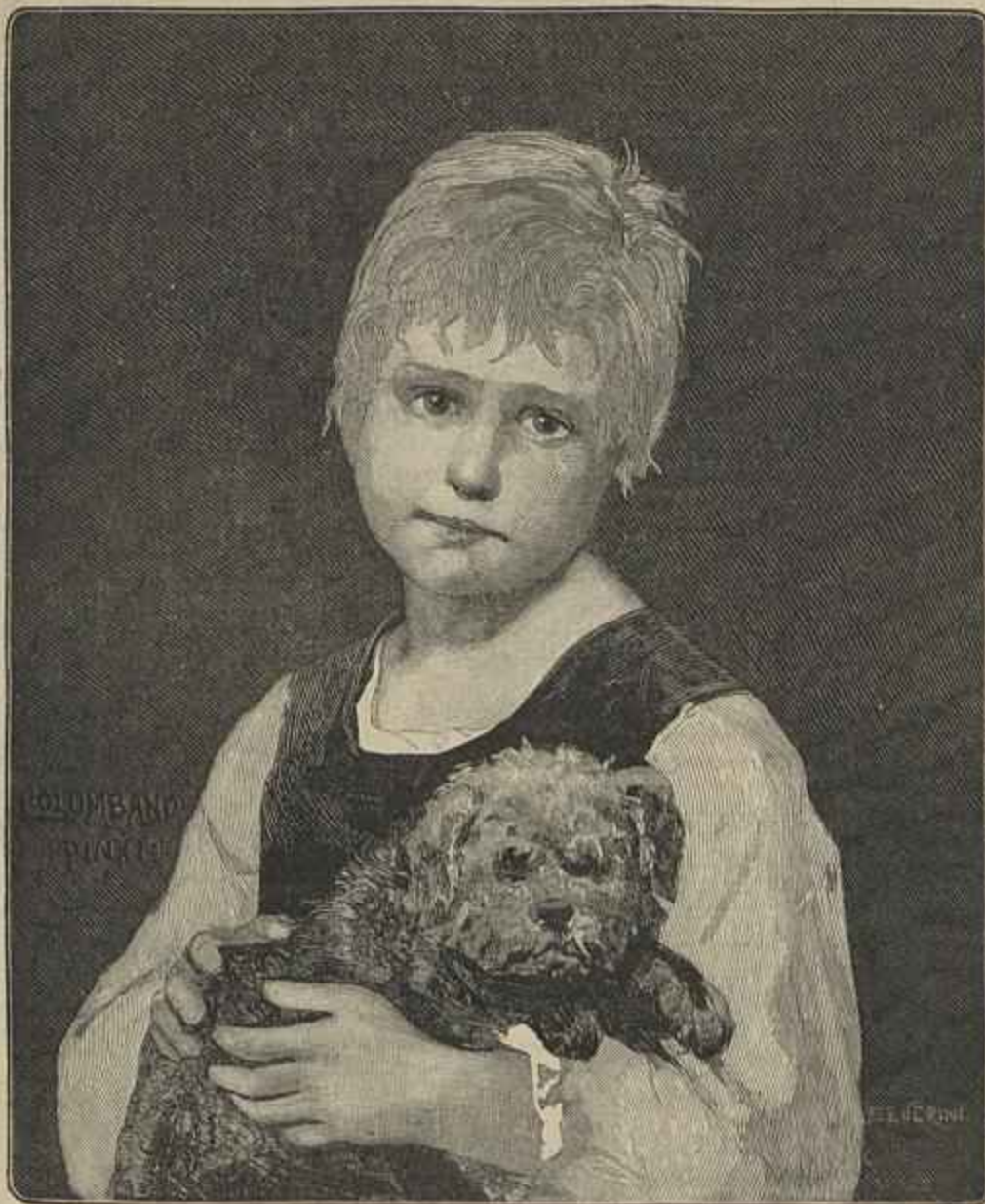
DOIS AMIGOS (quadro de Columbano Bordallo Pinheiro — desenho do mesmo auctor)

pelo vigor que punha em tudo que dizia e fazia. Era como a electricidade que se communicava, ou que prendia, subjugando, quantos o escutavam. Que admira que com tão distinctas e privilegiadas qualidades, preparasse com o jornal politico A Restauração da Carta , desde 1842 a 1846, a contra-revolução de 6 de outubro d'este ultimo anno, de que elle, cartista intransigente, foi a cabeça, o conselho, o instigador, para d'alli tirar por premio os desgostos que o levaram no anno seguinte a deixar a patria, a que podia, como deputado e como estadista, ter prestado relevantissimos serviços?