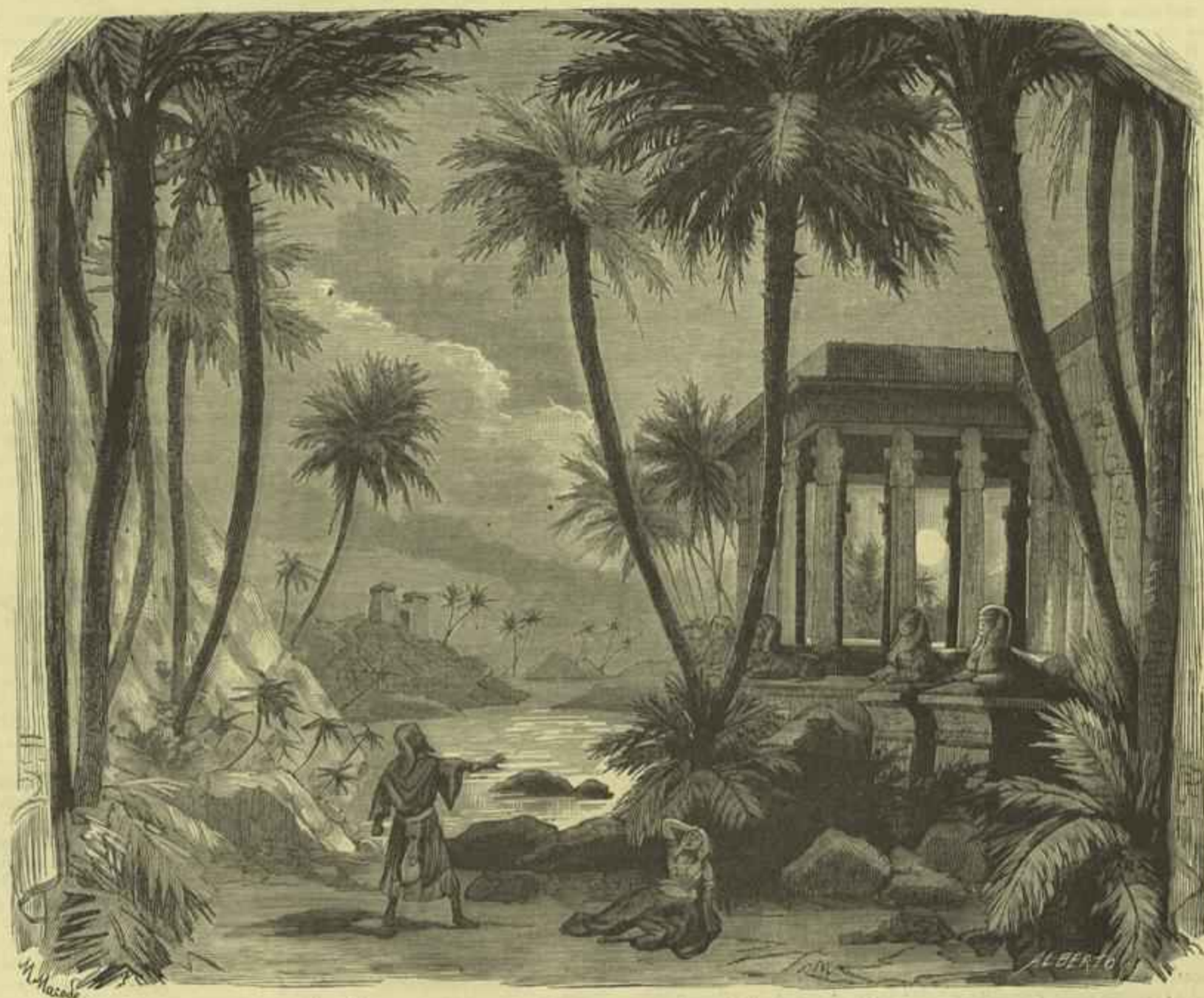
QUADRO DAS MARGENS DO NILO NO TERCEIRO ACTO DA «AIDA»