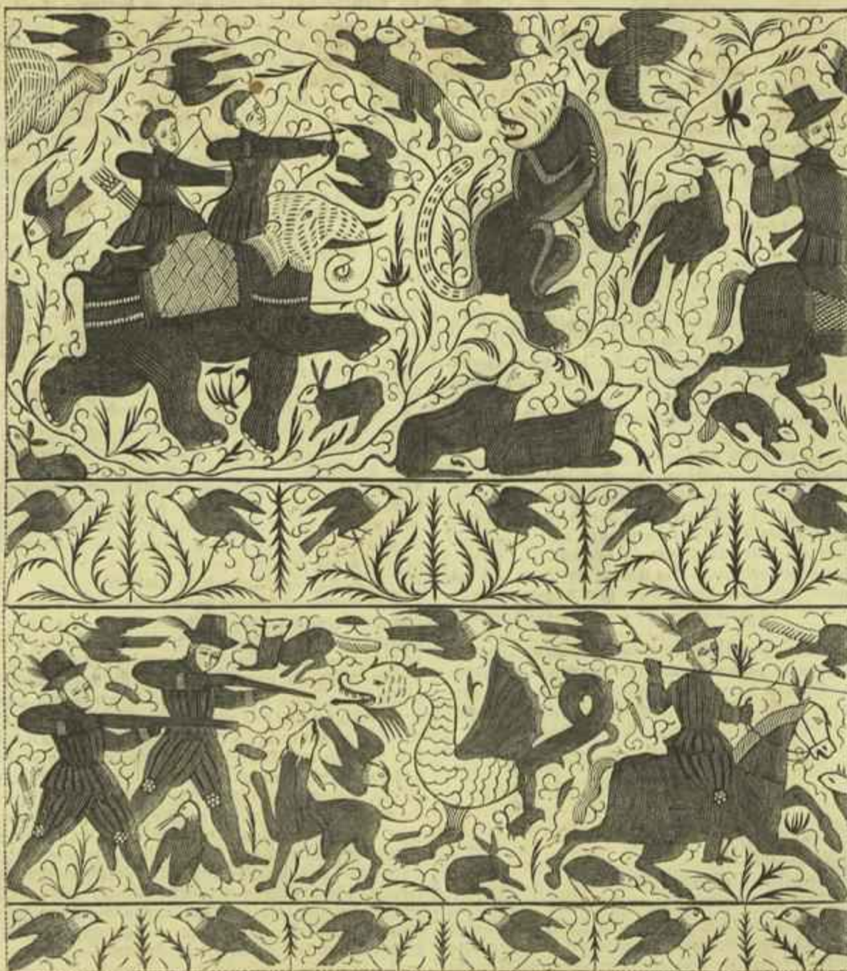
FRAGMENTO D'UM BORDADO FEITO PELAS DAMAS DE MALACA NO SEculo XVII