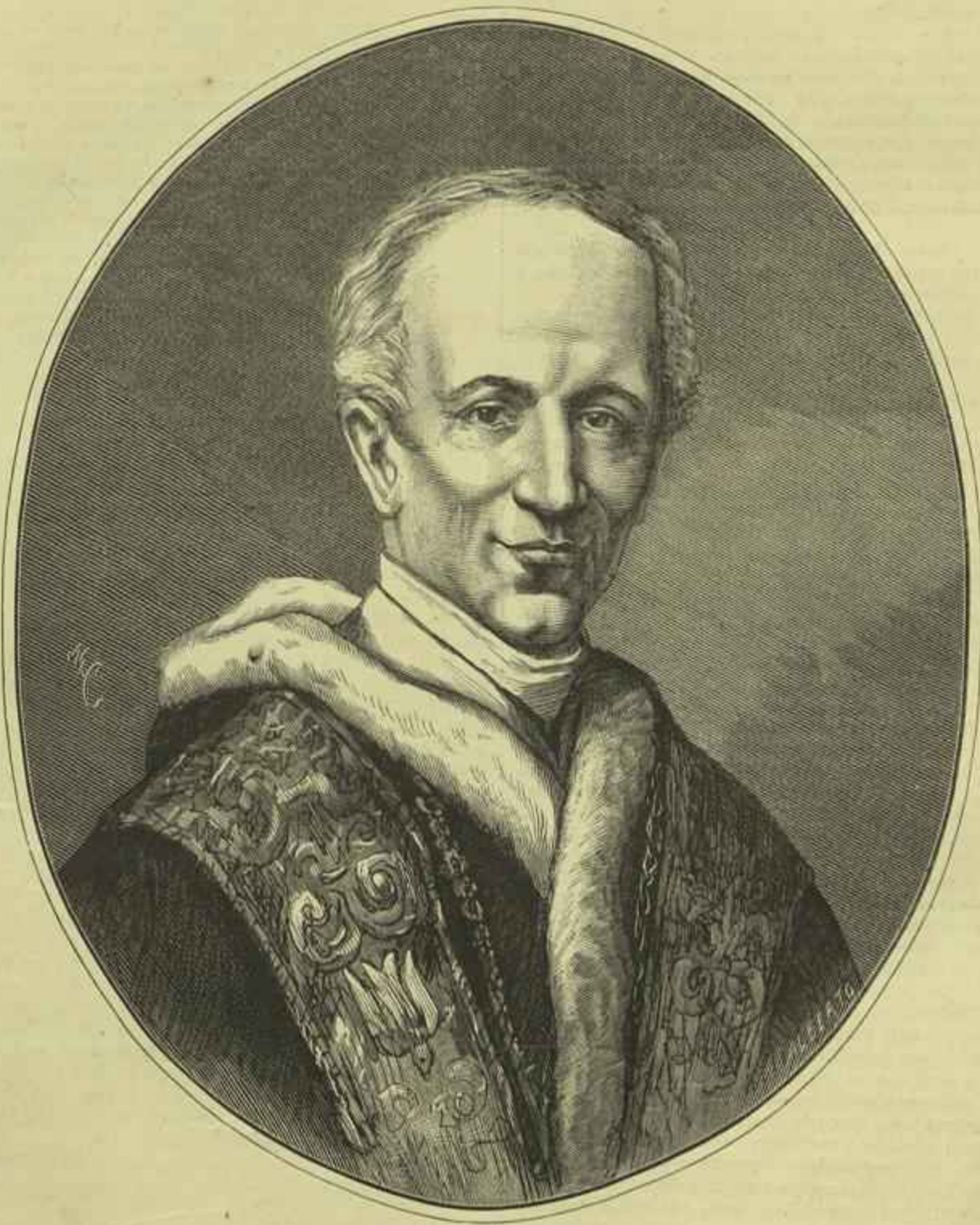
S. S. O PAPA LEÃO XIII