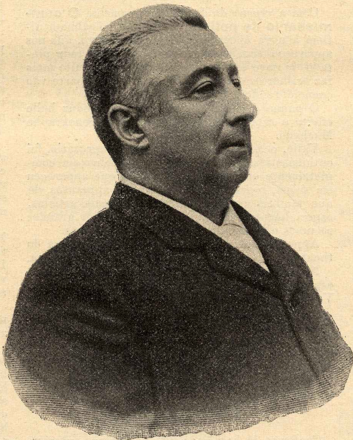
Actor Joaquim Costa

Discipulo do inolvidavel Santos, não foram as lições do grande mestre que o desenvolveram de prompto; mas d'estas lições tirou discreto aproveitamento que lhe serviu de orientação, e foi quando se encontrou entregue a si proprio e á pratica criteriosamente estudada, que o publico e a critica começaram de notal-o e aprecial-o.