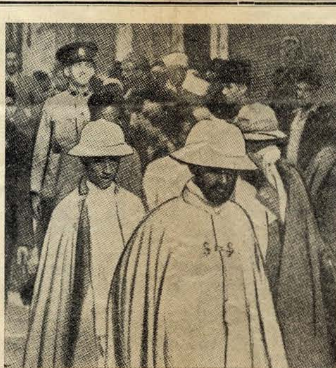
O «Négus», em traje de gala, com o príncipe e autoridades de Addis-Abbeba. Ler artigo na página 5