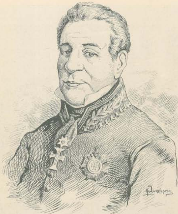
O CONDE DE FERREIRA

Foi um dos fundadores da Sociedade de Geographia em Lisboa; Obedeceu a um dos promotores do centenário do Camões. Desde 1870 que é lente a cátedra de contabilidade commercial no Instituto e começou a sua carreira politica pelo cargo de vereador na camara municipal de Lisboa em 1884. Foi tambem eleito par do reino por Portalegre em 1890 e por Lisboa em 1894. Quando deixou de haver pares electivos o sr. Rodrigo Prequito foi novamente eleito deputado por Lisboa no anno de 1900-1901, sendo agora chamado aos conselhos da corôa em substituição do sr. Teixeira de Sousa.