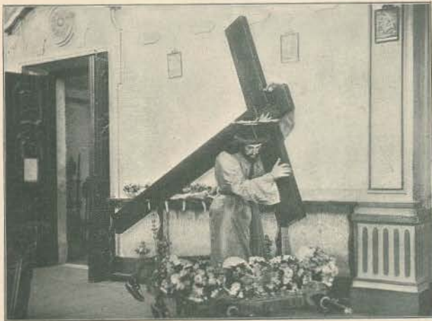
A PROCISSÃO DO TRIUMPHO—SENHOR DOS PASSOS