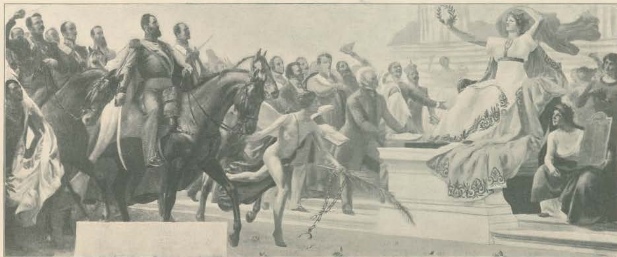
O QUADRO DE VELLOSO SALGADO DESTINADO AO MUSEU D'ARTILHARIA