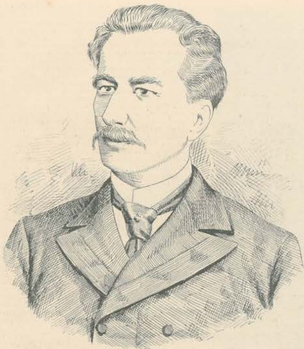
RODRIGO AFFONSO PREQUITO NOVO MINISTRO DA FAZENDA

Foi um dos fundadores da Sociedade de Geographia em Lisboa; Obedeceu a um dos promotores do centenário do Camões. Desde 1870 que é lente a cátedra de contabilidade commercial no Instituto e começou a sua carreira politica pelo cargo de vereador na camara municipal de Lisboa em 1884. Foi tambem eleito par do reino por Portalegre em 1890 e por Lisboa em 1894. Quando deixou de haver pares electivos o sr. Rodrigo Prequito foi novamente eleito deputado por Lisboa no anno de 1900-1901, sendo agora chamado aos conselhos da corôa em substituição do sr. Teixeira de Sousa.