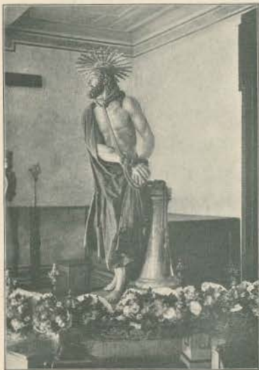
PROCISSÃO DO TRIUMPHO—SENHOR PRESO Á COLUMNA