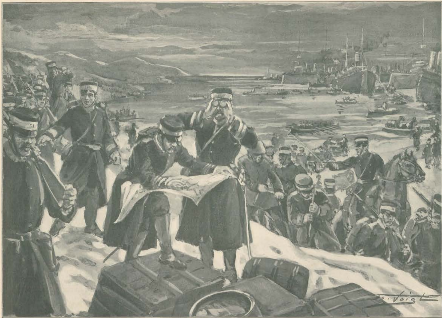
A GUERRA RUSSO-JAPONESA:—O DESEMBARQUE DAS TROPAS JAPONEZAS NA COREIA

Continuam a desembarcar tropas japonezas na Coreia e o povo coreano tem feito tumultos. Uma parte da população ligou-se aos russos, a outra aos japonezes e a guerra entre os estrangeiros ateia-se. Em Kang-Keoni deu-se um encontro entre russos e coreanos, ficando mortos 33 dos primeiros e 17 dos segundos. Mas o centro das operações é em Chemulpo, onde se encontram 25.000 japonezes, ao passo que em Gensan estão dois exercitos de 25.000 russos e entraram em combate. Todos os dias mais tropas desembarcam, movem-se grandes forcas d'artilharia, a cavallaria chega em esquadras cerra-