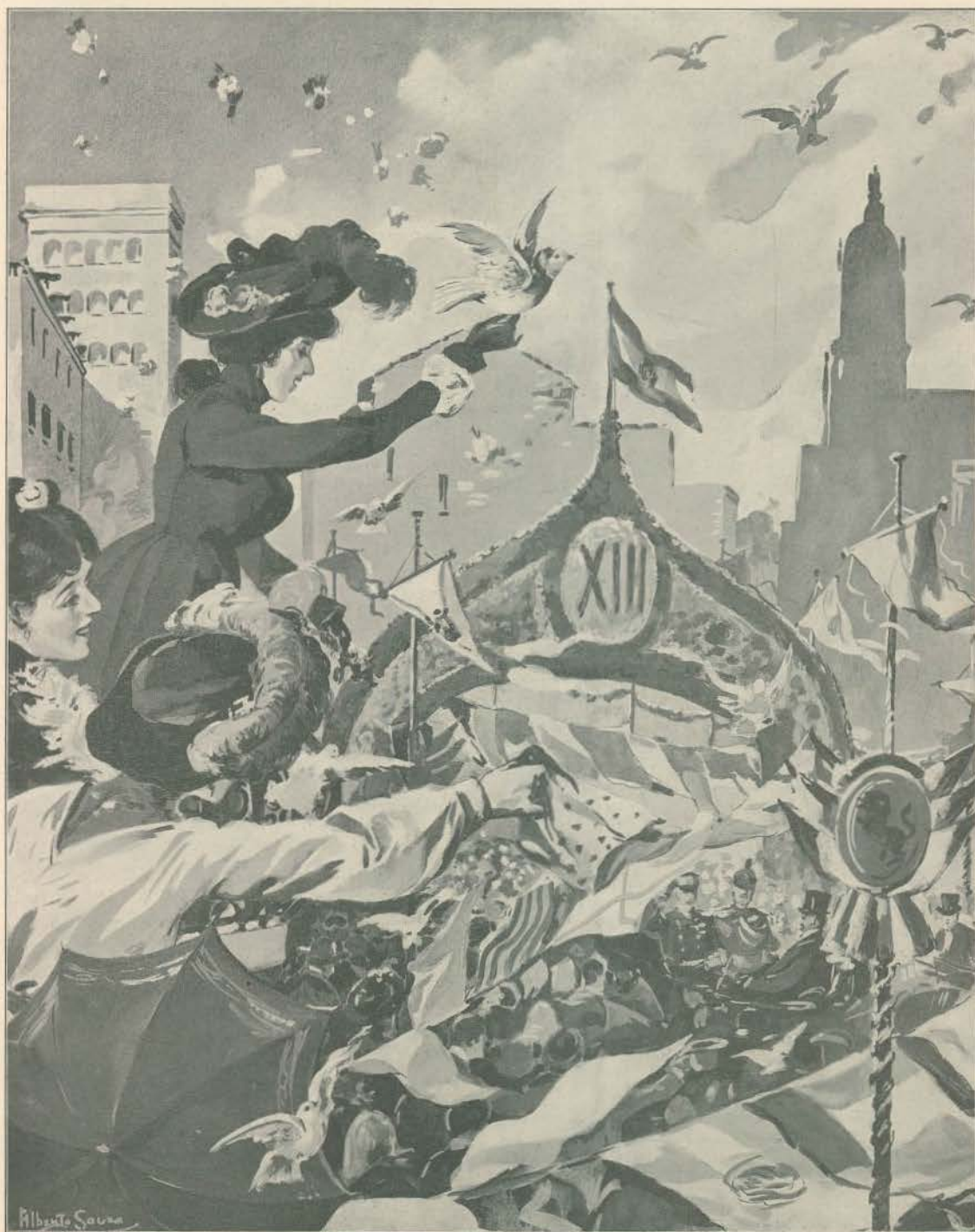
A VIAGEM DO REI DE HESPAÑA:—A PASSAGEM DO COETEJO NAS RUAS

A' volta da entrevista com Guilhermo II, o rei de Hespanha atravessou algumas cidades do seu reino e foi ostensivamente aclamado. Agora vai a Barcelona onde os elementos revolucionarios prepararam contra-manifestações que o alcalde declarou ter abafado, sendo, por isso, de esperar que haja uma vehemencia d'applausos eguaes aos de Guadalajara: Quando S. M. puser nas ruas, as damas deitaram das janellas flores e pombos que voavam n'uma apothose de fitas coloridas, e povo batia palmas e no rosto melancolico do joven soberano havia uma aberta de alegria.