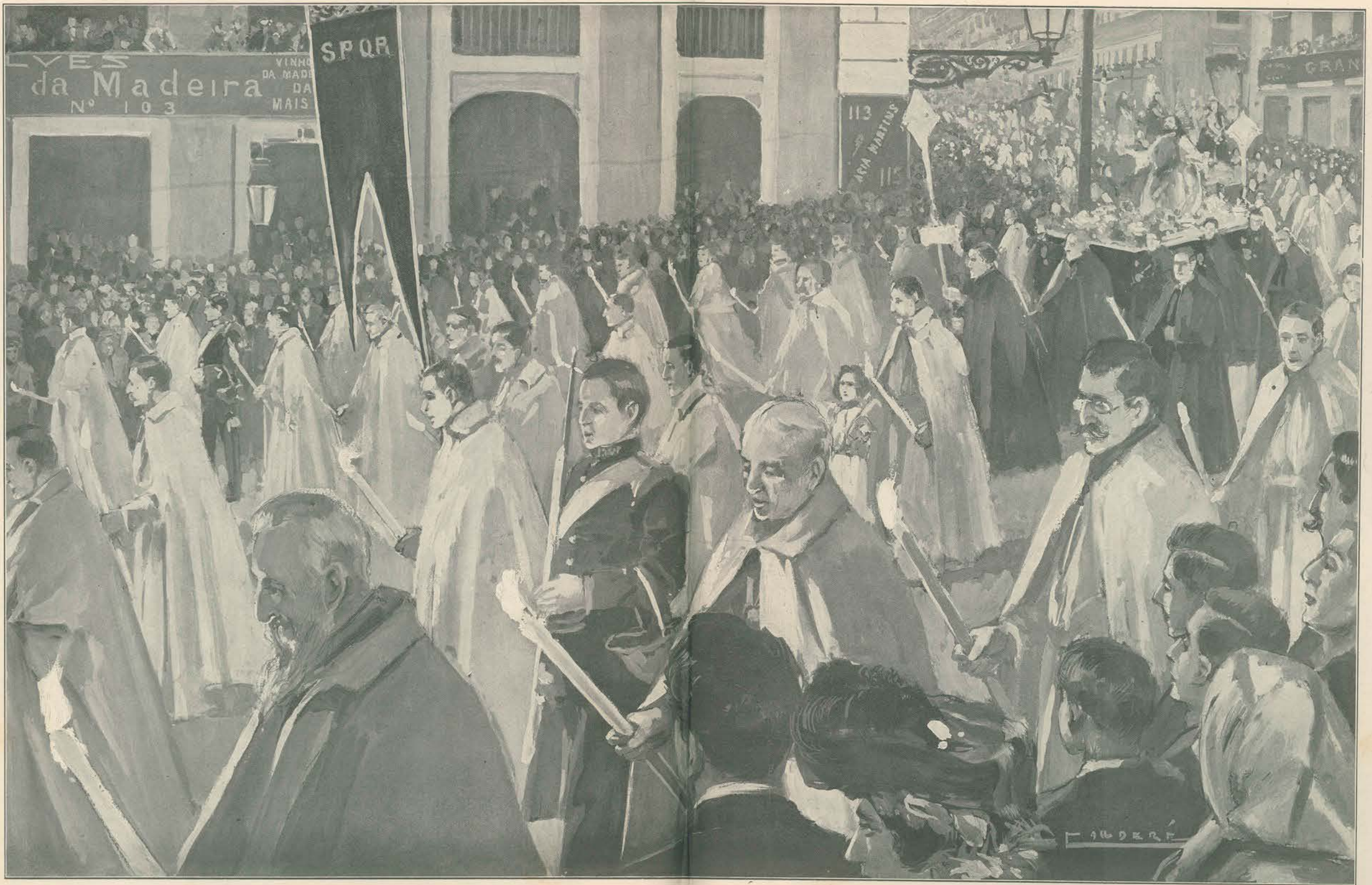
A PROCISSÃO DO TRIUMPHO EM DOMINGO DE RAMOS

É ainda a procissão que recorda os tempos fastuosos da devoção no regimen absoluto, quando os cortejos religiosos se faziam com pompa n'uma exposição allegorica e rica, com os fidalgos pegando ás varas dos pallos, com os sacerdotes recamados d'ouro, n'umas nuvens odoríferas d'incenso que revolteavam nos thuribulos e nas cascoetas d'ouro, atravessando as ruas diante do povoem prostrado e respitoso. Eram luzidas e enormes as imagens, opulentamente adornadas como essas que vão na procissão do Triunpho. É um cortejo da Paixão, uma historia epica e animada da vida de Christo, que passa na cidade n'uma gloria de vestes recamadas d'ouro, com as suas lanternas accensas, com as suas imagens de