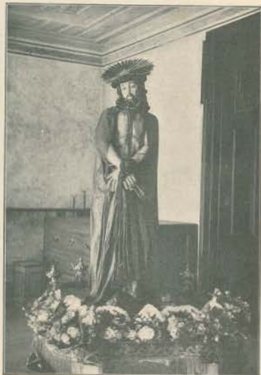
A PROCISSÃO DO TRIUMPHO—ECCE HOMO