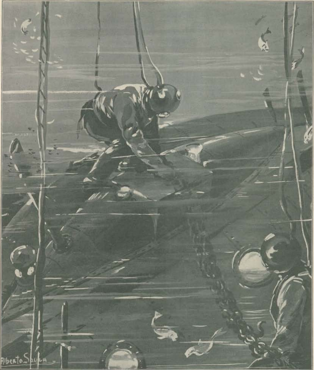
OS TRABALHOS DOS MERGULHADORES NO SUBMARINO N.º 1 DA MARINHA INGLEZA NAUFRAGADO PERTO DO CABO NAB

A flotta dos submarinos Ingleses andava nas manobras navaes e a sua tarefa consistia em mergulhar d'um lado dos navios e surdir pelo outro depois de ter simulado um ataque. O principe de Galles assistia á immersão do submarino n.º 1 e a tripulação satisfellta tomara os seus lugares para continuar as manobras. Consistia de onze homens, incluindo 2 officiaes, a equipagem do barco que deslocava 200 toneladas. Porém á noite, quando se fez a chamada, viu-se que faltava o submarino em questão e como n'essa tarde o Renick Castle , um navio de carga que ia para Hamburgo, elcilarava ter tocado n'um torpedo para lá do cabo Nab, acreditou-se desde logo n'um desastre e fo-