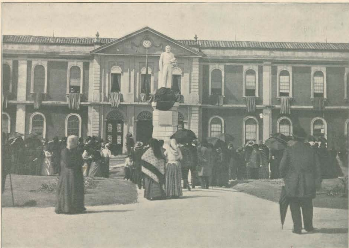
A INAUGURAÇÃO DO MONUMENTO DO CONDE DE FERREIRA NO PORTO