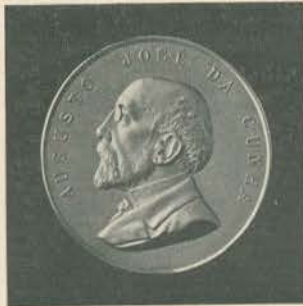
ANVERSO DA MEDALHA

Nasceu em 1890 em Osiras. Agora vive em Paço d'Arcoas. Tem ainda fotos os trabalhos domesticos e esse seu sorriso de seculos. Na era oitava doente e foi nos seus tempos uma mocilla garbosa. Viu passar os seculos, é um curioso documento vivo que pode ser um bello auxilio para a historia anecdotica da existencia de D. Miguel no Paço de Caxias.