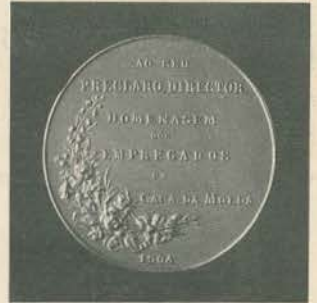
REVERSO DA MEDALHA