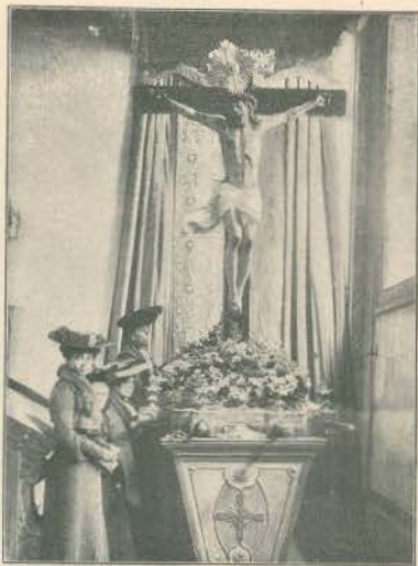
A PROCISSÃO DO TRIUMPHO—O SENHOR CRUCIFICADO

Porém a galeria esperava mais, esperava muito mais e já grita de novo, já cresce... e o domingo