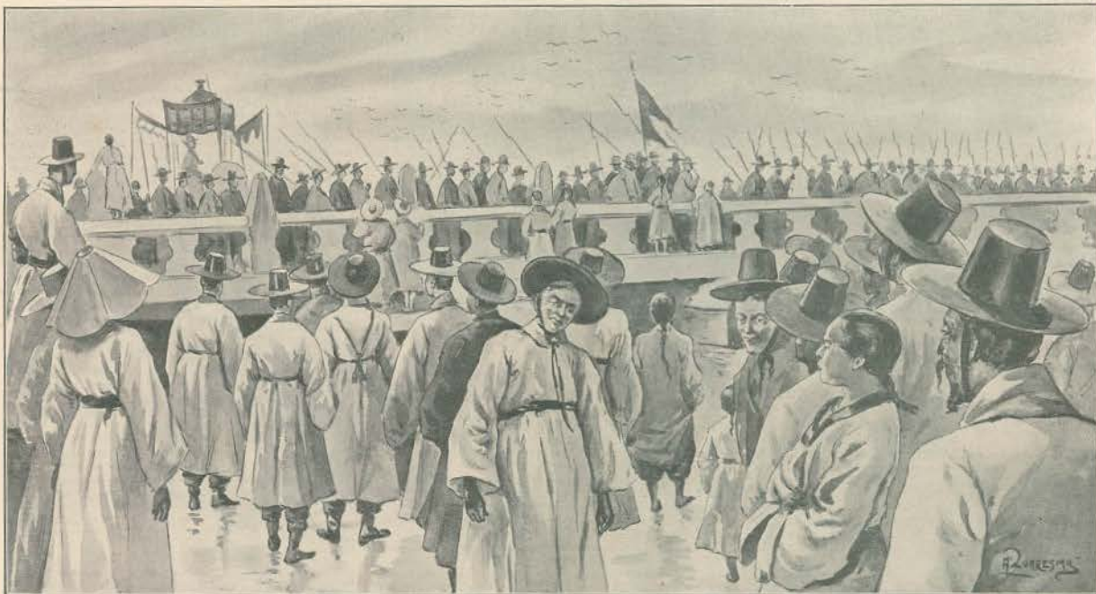
A GUERRA RUSSO-JAPONESA: — O CORTEJO DO REI DA COREIA INDU AO ENCONTRO DO MARQUEZ ITO