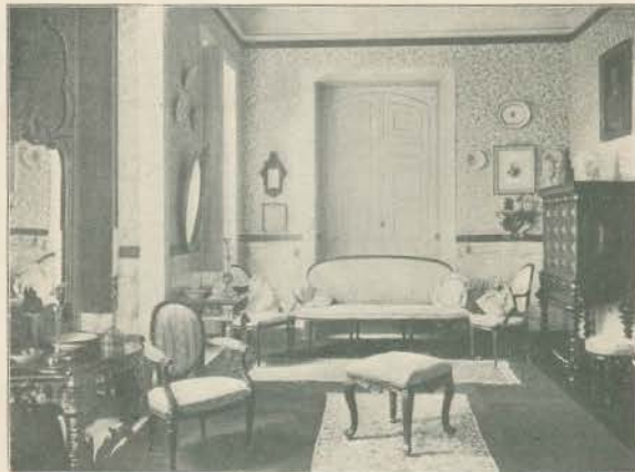
UMA SALA LUIZ XVI

E' assim a habitação finamente artistica que visitamos.