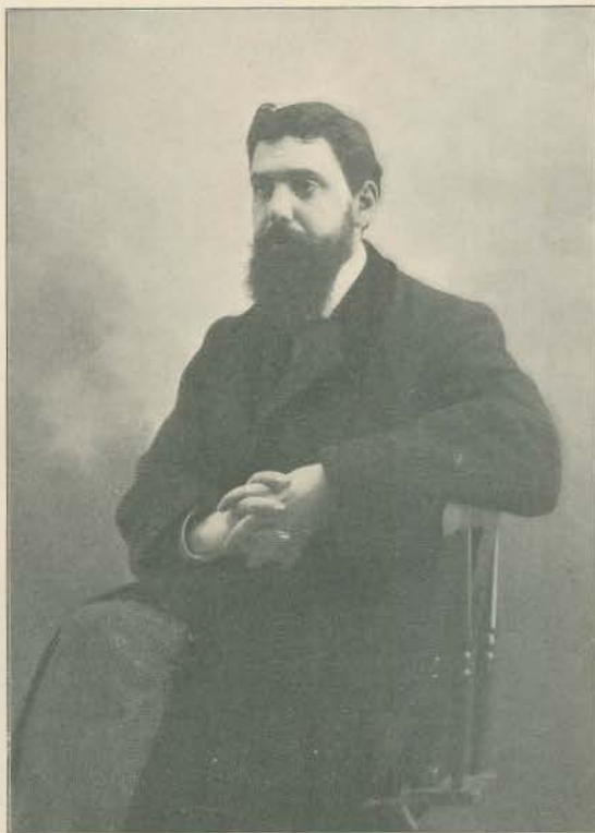
TEIXEIRA LOPES, O AUCTOR DA ESTATUA