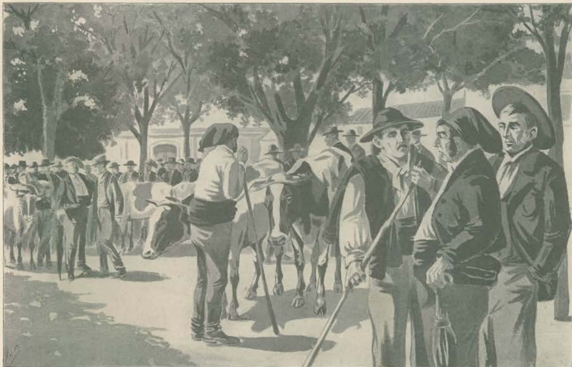
UM ASPECTO DA ULTIMA FEIRA MESSAL DE GADO NO CAMPO GRANDE.