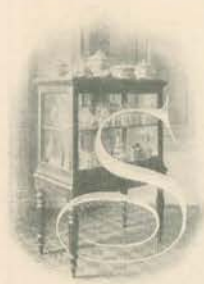
A VITRINE DAS FAIANÇAS