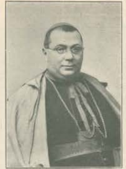
SUA EMINÊNCIA O CARDEAL AGUIAR ex-nunçe apostólico em Lisboa