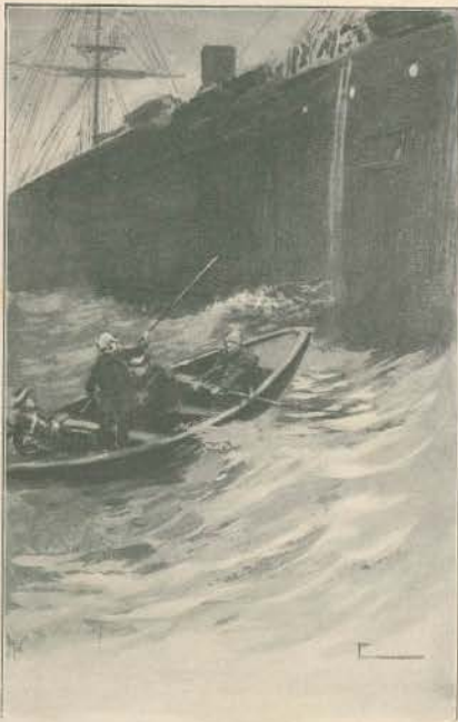
A Grécia moderna.—Grandeza cabida.—Navegando pelo Archipelago e os Dardanellos.—Pegadas da história.—Fundos do porto de Constantinopla.—Trajes frascotes.—O engenheiro guardador de patos.—Alfajedes assabrosos.—A grande mesquita.—As mil e uma columnas.—O grande bazar de Stambul.

Em toda a extensão que percorremos através das ilhas do archipelago grego não vimos senão costas fastidiosas e montes estériles, algumas vezes coroados por tres ou quatro columnas elegantes de algum tempo antigo, solitario e deserto—symbolo apropriado da asolação que alastrou por toda a Grécia n'estes últimos seculos. Os campos que se viam não estavam arados, aldeias poucas, arvores, relva ou vegetação de qualquer especie, muito raras, e rarisimo lobrigar uma casa separada. A Grécia é um triste e sombrio deserto, aparentemente sem agricultura, fabricas ou commercio. O que sustenta o seu povo ou o seu governo, cheios de pobreza, é um mysterio.