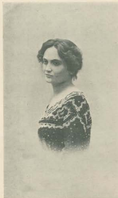
A ACTRIZ ITALIA VITALIANI L DA JOHENSE CARLOS DECE E QUE REPRESENTOU NO THEATRO DA TRINDADE AS PEÇAS «DAMA DAS CAMÉLIAS», «TORÇA» E «MAIADA»