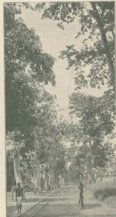
QUELMANE—A CONTINUAÇÃO DA RUA DE S. DOMINGOS