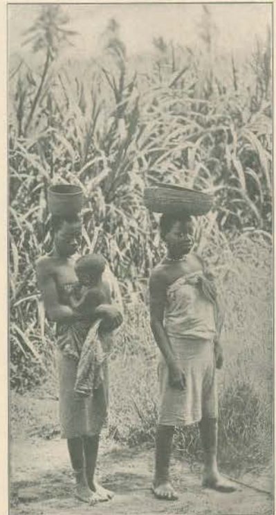
QUELMANE—MULHERES NEGRAS N'UMA CONDUÇÃO