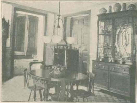
A SALA DE JANTAR

Entre duas janellas, uma ampla chiffre onduçada