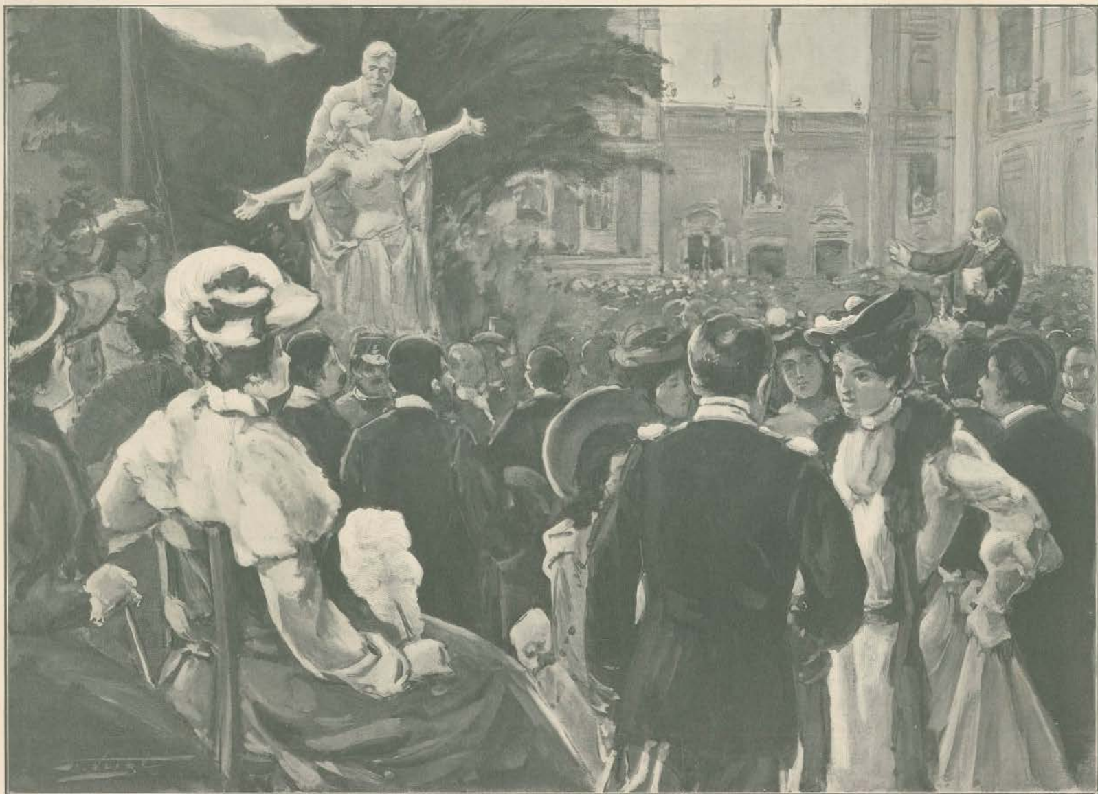
INAUGURAÇÃO DO MONUMENTO A EÇA DE QUEIROZ, REALISADA EM 9 DE NOVEMBRO NO LARGO DO QUINTELLA. — RAMALHO ORTIGÃO LENDO O SEU DISCURSO