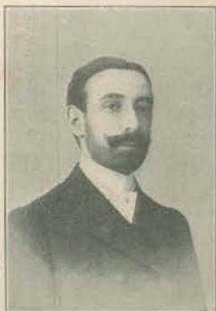
ALBERTO D'OLIVEIRA Ministro de Portugal em Stockolmo e auctor da poesia escripta em homenagem a Eça de Queiroz