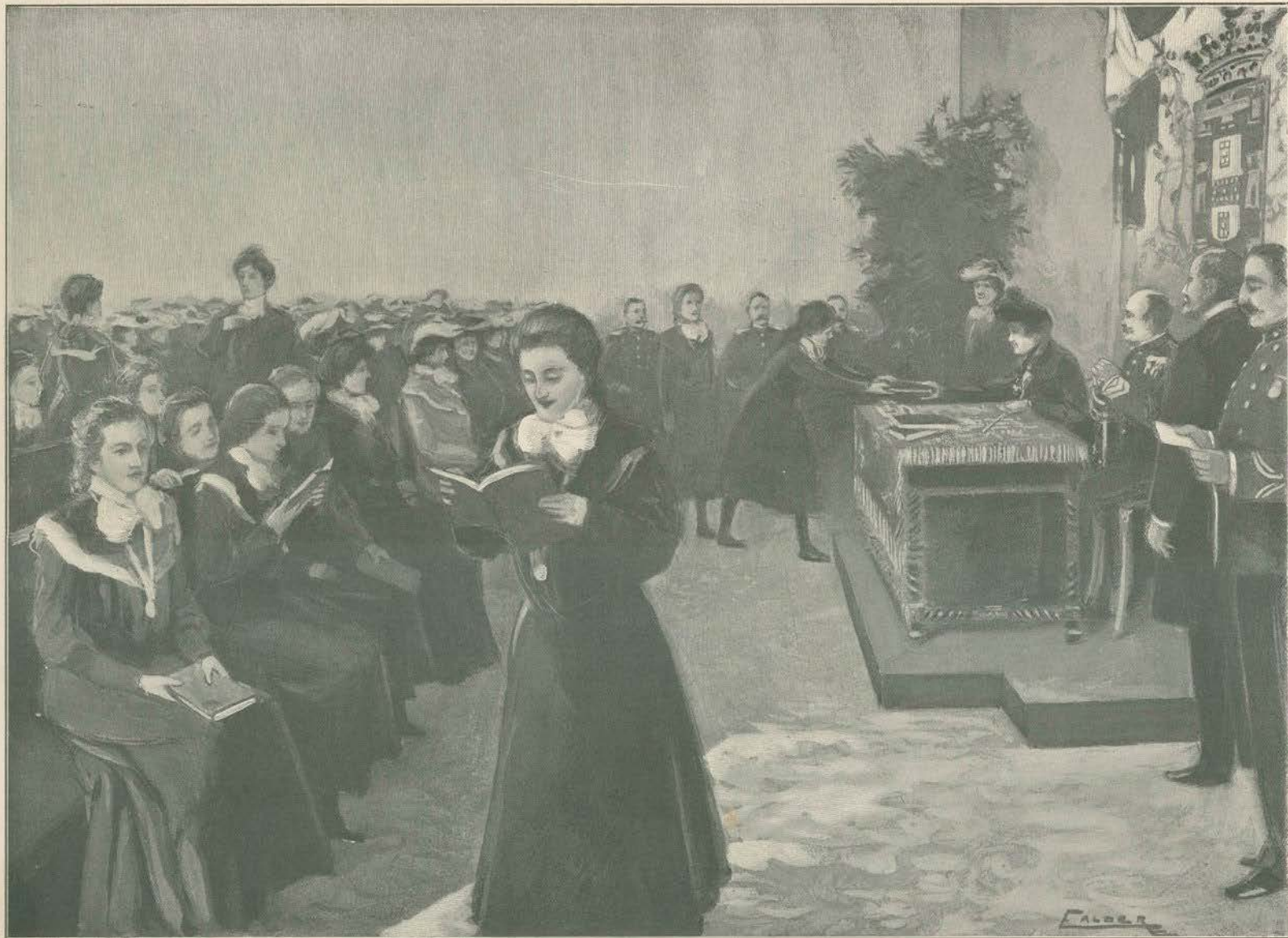
A DISTRIBUIÇÃO DE PREMIOS NO INSTITUTO D. AFFONSO, CREADO PARA INTERNATO DAS FILHAS DOS OFFICIAES FALLECIDOS

S. M. A RAINHA SENHORA D. MARIA PIA, COM SUA ALTEZA O SENHOR INFANTE D. AFFONSO, PROTECTOR DO INSTITUTO, PREMIANDO AS ALUMNAS MAIS CLASSIFICADAS NOS EXAMES DO ANNO ANTERIOR, NA ULTIMA SESSÃO EM 1 DE NOVEMBRO