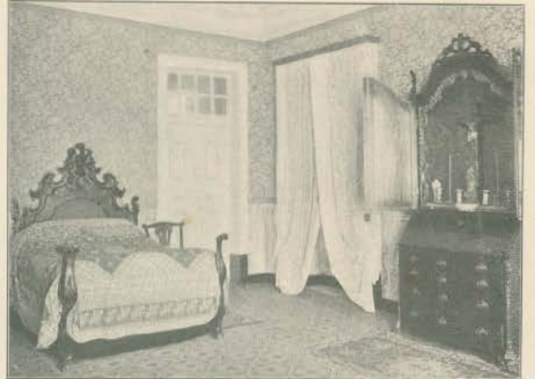
UM QUARTO DE DORMIR

— Lisboa tem correio duas vezes por semana. O da Beira chega á sexta e parte ao domingo pela manhã. O do Alentejo, Algarve e Andaluza chega á segunda e parte á terça de tarde. Os de Madrid, França, Italia e