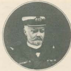
O CONDE-ALMIRANTE IVO FERREIRA Fallecido em 8 de novembro