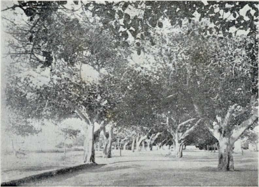
SUB-BOIS — por F. G.