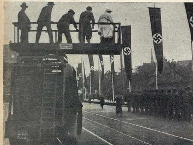
Montado sobre um enorme camião eis a praticável utilizada para o filmagem de desfiles