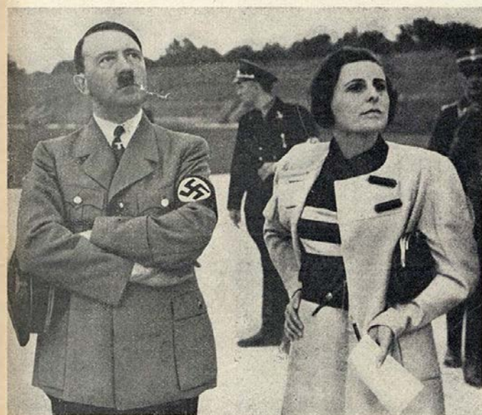
Hitler, chanceler do Reich, e Leni Riefenstahl, realizadora «attitrée» dos filmes de propoganda nacionalista, seguem interessadas as tomadas de vistas, aéreas, feitas de bordo dum avião que sobrevoa o campo