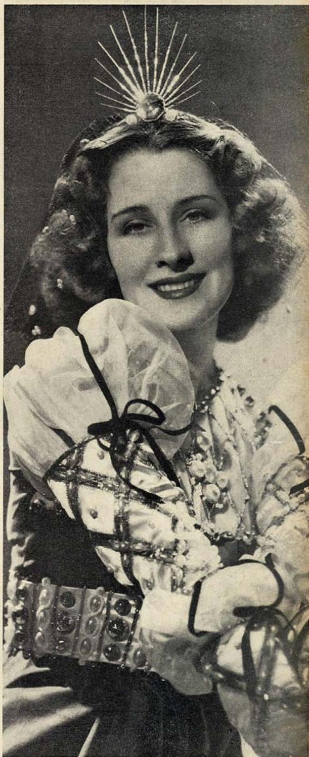
Doce, angelical — eis Norma Shearer, no papel de Julieta, da filme «Romeu e Julieta»

Intervem então o juiz White que interroga Freddy, o qual não regateia elogios à tia Mabel. Foi ela quem o obrigou a estudar dieção, quem lhe procurou os primeiros contratos em Inglaterra e