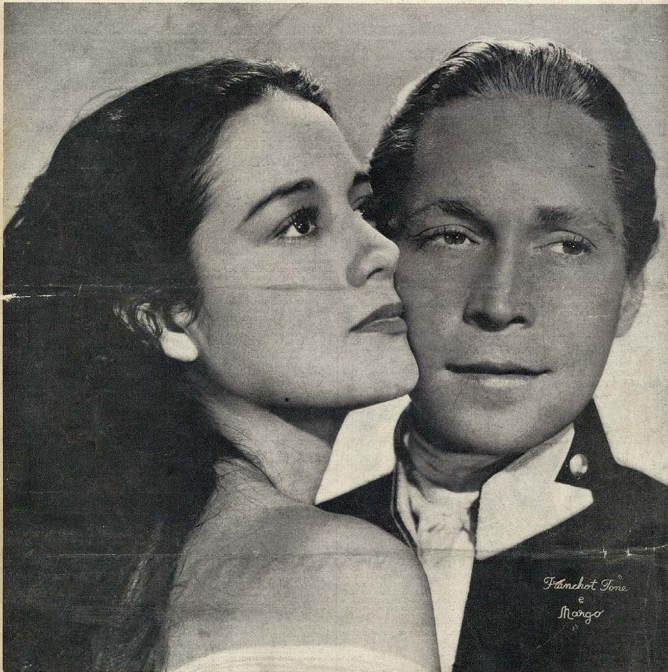
Franchot Tone e Margo

ANO 1.º — N.º 49 — 21 DE SETEMBRO DE 1936 — SAÍ TODAS AS SEGUNDAS-FEIRAS — 16 PÁGINAS — PREÇO 1$00