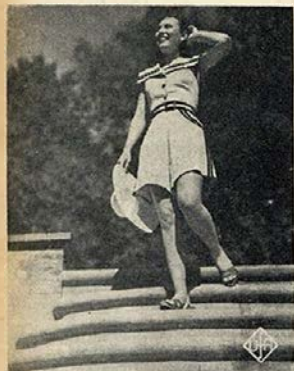
Lido Baarova, imagem da Primavera...