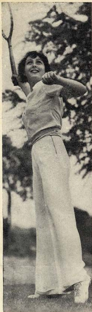
Luise Rainer, jogadora de «tennis»