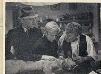
Sob o ameaça da revólver o veterinário fez a extracção do bala