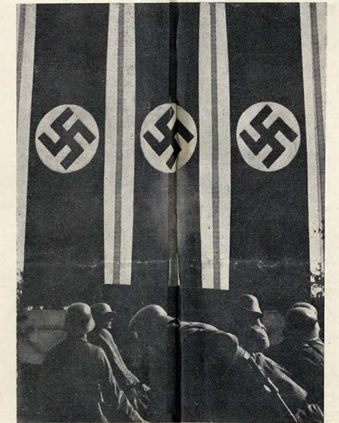
Uma imagem alegórica da Alemanha hoje, forte e dominadora