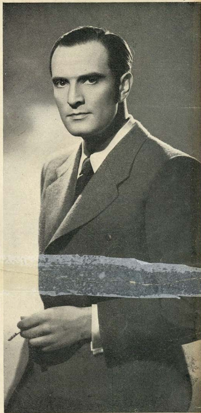
Hans Stuwe, o grande actor alemão, que temos visto em vários filmes da Ufa

No Cinema Nacional, estão, felizmente, aparecendo novos elementos, que, indiscutivelmente, a valorizam. Da muita quantidade, há-de necessariamente, restar a melhor qualidade, — e isto por uma melhor facilidade de escolha. Não vamos, porém, começar a incensar, desordenadamente, todos os novos que