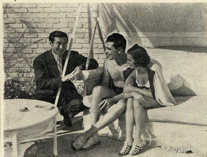
Sally Eilers recebe as seus convidadas na piscina dos estúdios