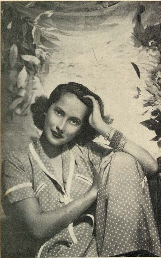
Merle Oberon, a mulher que encantou J. Schenk, e que este, «generosamente», tornou numa das grandes vedetas americanas.