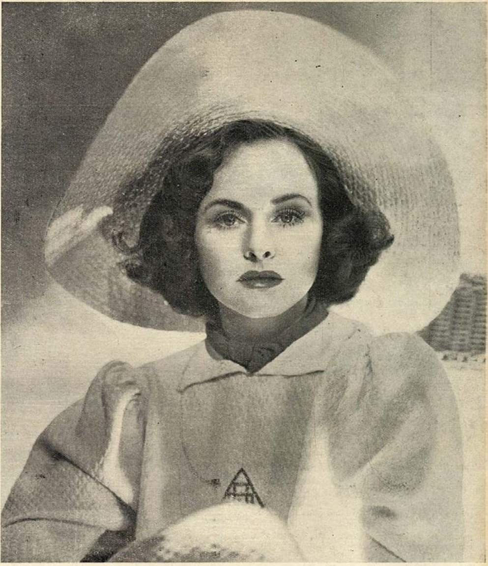
Paulette Godard, a mulher de Charlie Chaplin! Ela: 19 anos, incompletos. Ele: quasi sexagenário. Não estario aqui o ponto de partida para um filme do próprio Charlot?