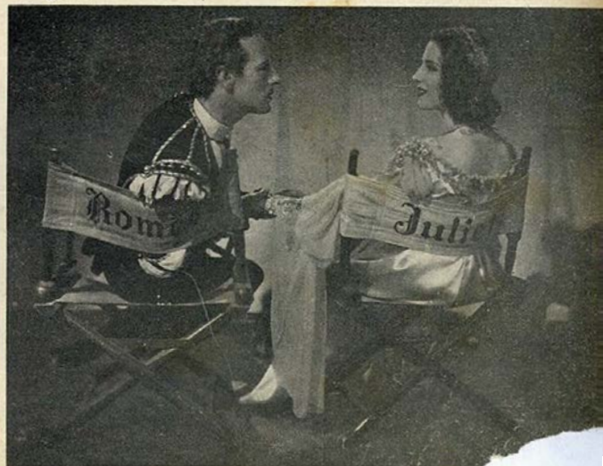
Leslie Howard e Norma Shearer — ou Romeu e Julieta, d

Walt Disney tendo tornado público que desejava contratar 30 desenhadores, recebeu, num só dia, mais de 6.000 propostas. Nos seus estúdios trabalham cerca de 300 artistas.