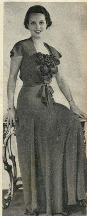
Rochelle Hudson, a companheira favorita de Shirley Temple

A vida ao ar livre e desportiva é, entre os americanos, quasi religião. Quanto mais novos mais entusiastas. Eddie Quillan é dos mais pequenos e portado dos artistas de Hollywood que mais adoram os desportos.