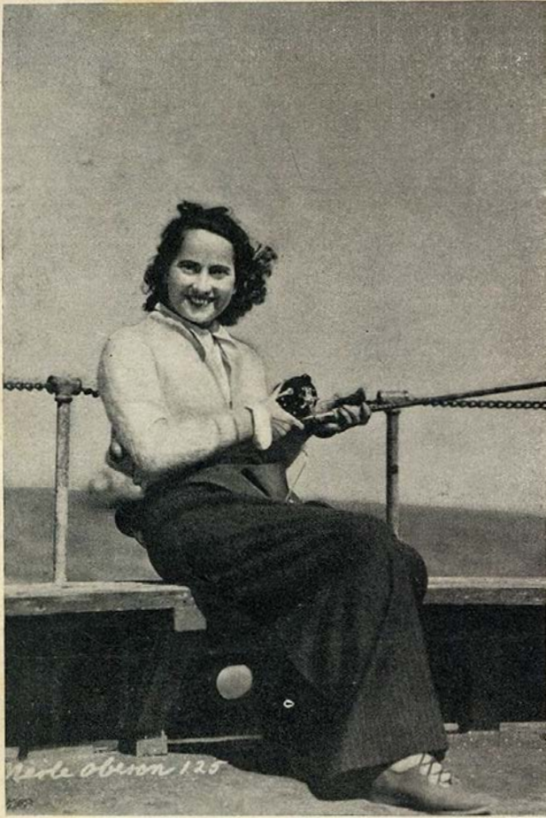
Merle Oberon deito o anzol, o ver se o peixe morde...