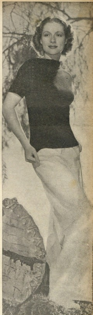
Loretta Young demonstra que uma mulher não perde a sua feminilidade, mesmo quando enverga trajes masculinos