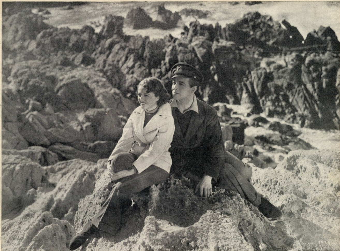
Uma imagem de Verão! Robert Taylor e Janet Gaynor fogem da cidade, vão até ao mar, e falam de amor ao som das ondas, que se quebram nos penhascos. Uma cena de «A pequena da Província» (Small town girl), que veremos na próxima época