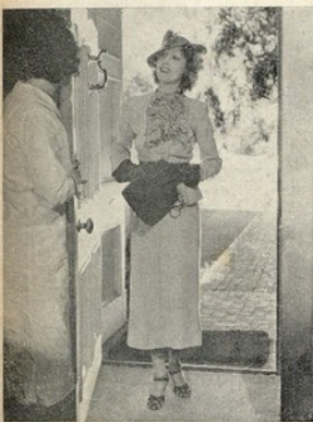
Jeannette Macdonald chega a sua casa, de regresso dos estúdios