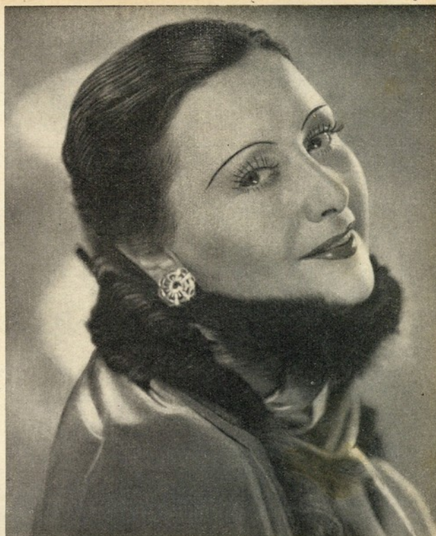
Lil Dagover, uma das mais graciosas e elegantes vedetas do cinema alemão, como nos aparece num dos seus últimos filmes