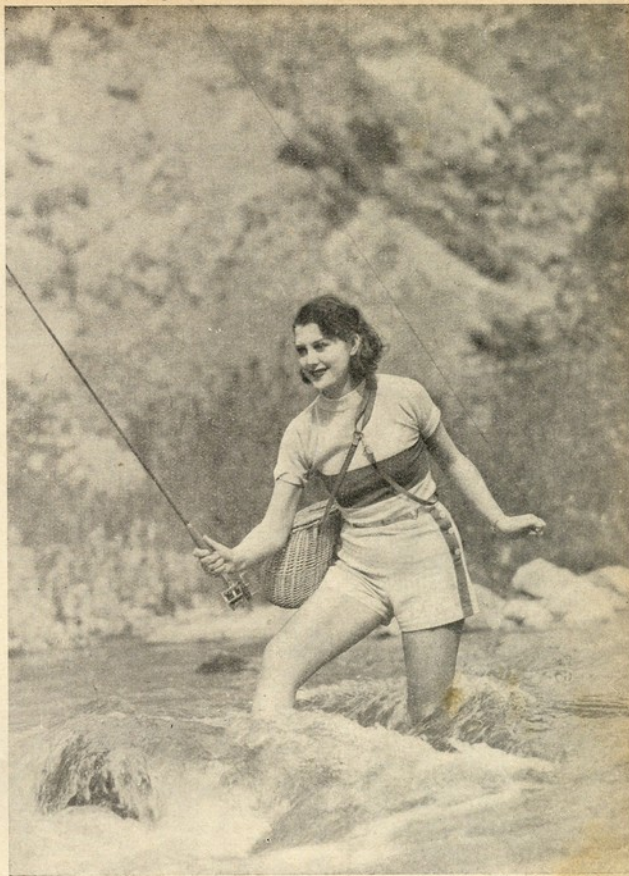
Pesca milagrosa?... Assim parece, a julgar mos pela graça da pescadora, uma «girl» dos estúdios, que ainda não é célebre

Também serão filmados os Jogos Olímpicos em filme de formato reduzido, pelos conhecidos especialistas Körner e Wunsch.