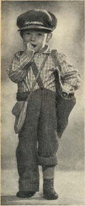
Um engraçado vendedor de «Cine-Jornal»

perdeu a vontade de voltar ao cinema, na Alemanha. Não gozou nada, com a preocupação constante de evitar alguma observação do parceiro do lado. Esteve quieto e mudo, como um peixe.