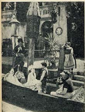
Durante uma das filmagens de «Ano Karenine», Clarence Brown dirige Greta Garbo