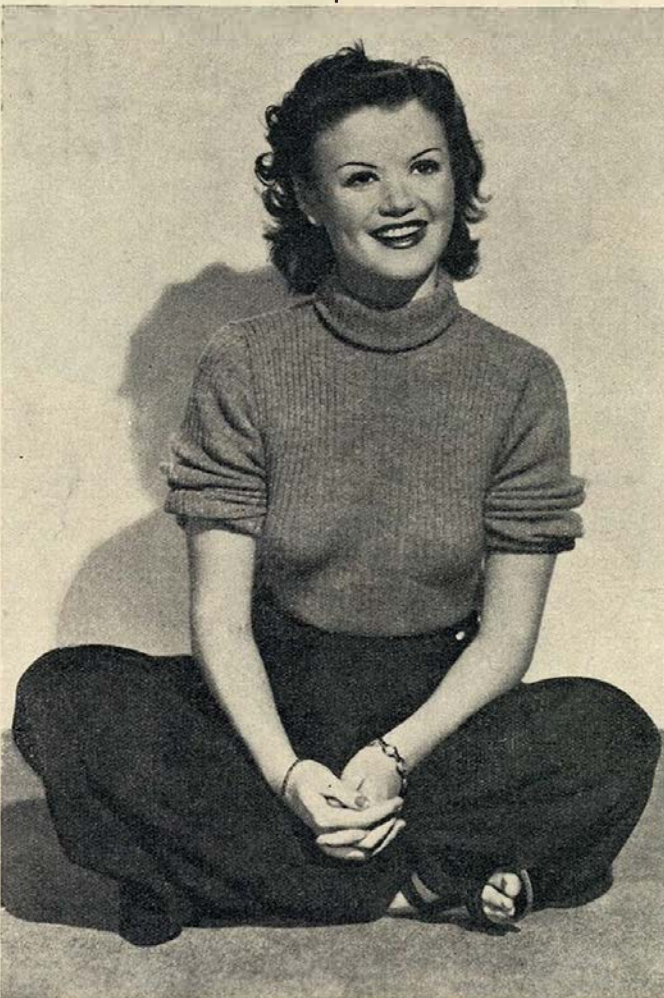
Simone Simon, o último desilusão do América...

cinematográfico do Porto que na ocasião em que, no átrio deste cinema, foi descerrada a fotografia do distinto cineasta português, tributaram a Leitão de Barros uma vibrante manifestação de simpatia e admiração.