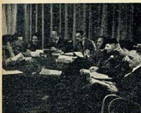
A primeira leitura de papéis para o filme Romeu e Julieta. Reconhece-se Norma Barrymore, Frederick March, etc.