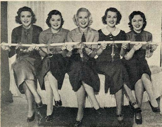
Cinco das mais recentes «descobertas» do Metro