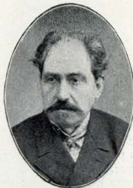
Rio de Carvalho

MAGICAS: A filha da noite, Amores do diabo, Sombra do Rei, Pomba dos ovos de ouro, Diamante vermelho, Pera de Satanaç, Varinha de condão, Espelho da verdade, Anel prodigioso, El-rei Maringombé, Diabo negro, Espirros do diabo, etc.