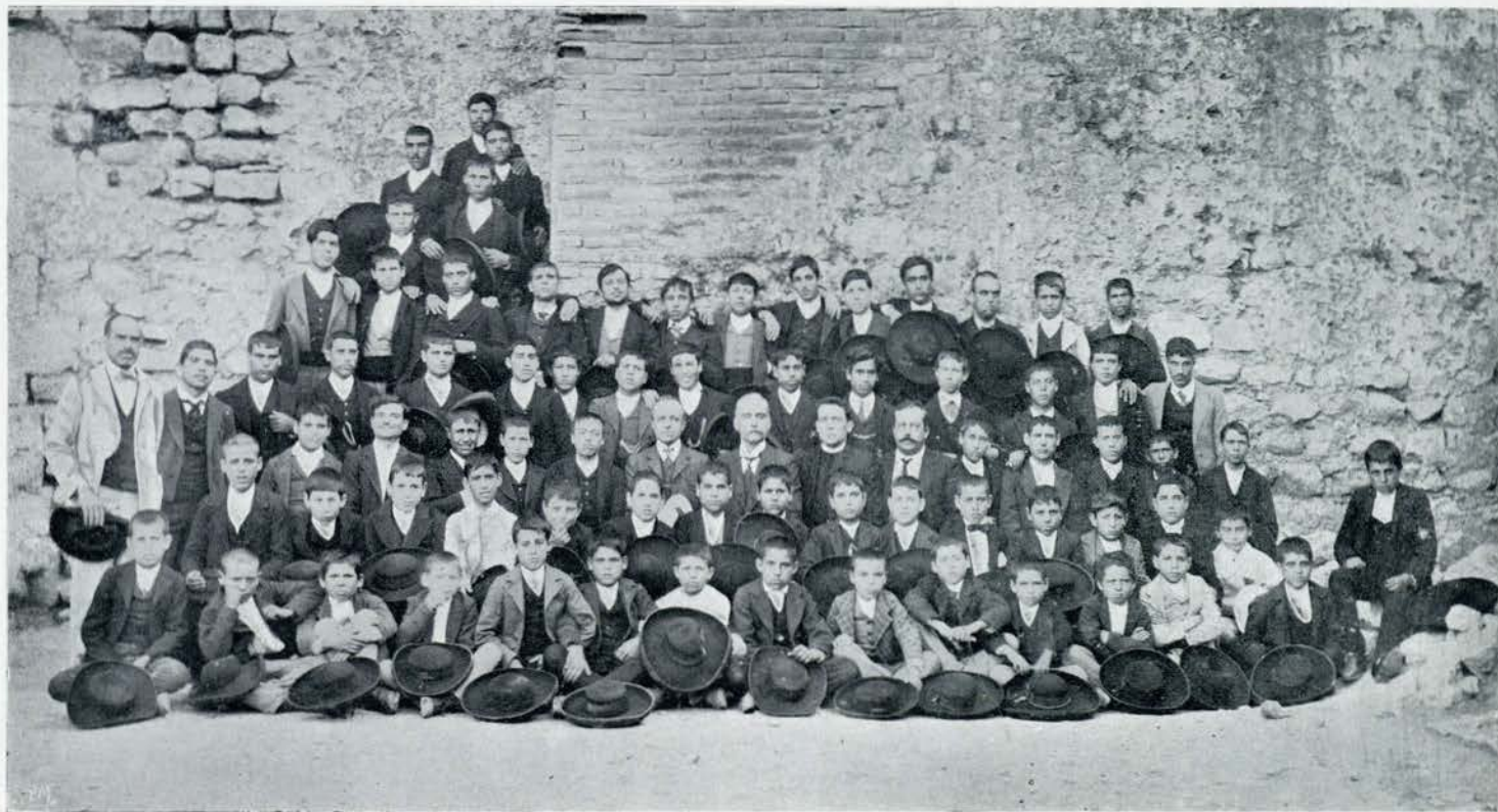
O Orpheon de Serpa