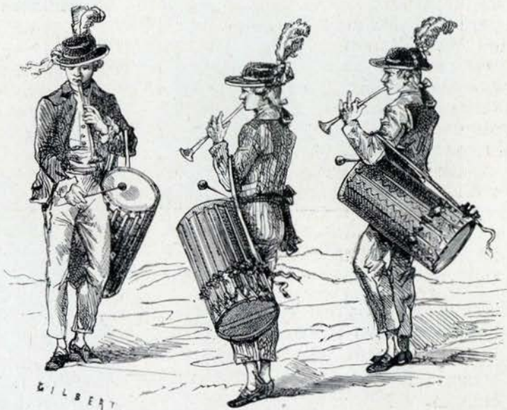
TAMBORILEIROS DE OUTR'ORA

dos seus congeneres em que o corpo do instrumento é muito mais longo, sendo as membranas vibrantes feitas geralmente de pelle de cão e a superior a mais delgada.