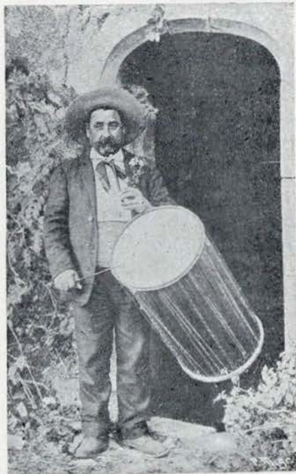
O TAMBORILEIRO D'HOJE

As vezes reune-se até um consideravel nu-