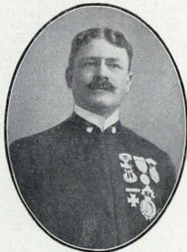
Herbert L. Clarke

Além d'estes importantes logares, tem exercido os cargos de director auxiliar das afamadas Bandas de P. S. Gilmore, Victor Herbert, Innes e John Philipp Sousa.