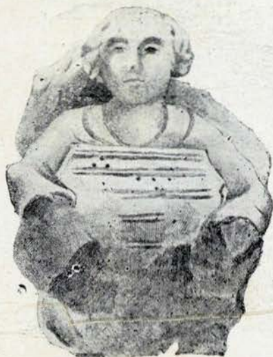
Fig. 6. — Dulcimer

Por não ser muito conhecida, reproduzo ainda (fig. 6) uma escultura mutilada, que se encontrou em uma igreja da Escocia, e que dará uma ideia, ainda que imperfeita, do que era o salterio do século XV 1 . Muito mais nitida é a reprodução que Augusto Tolbecque fez ha poucos annos do salterio que figura na portada da igreja de S. Pedro de Saintes (Charente Inferior), e que offereceu ao Museu instrumental de Bruxellas (fig. 7). O instrumento, que parece ter attingido por essa época as suas proporções definitivas, tem 32 cordas, afinadas aos pares, em unisono; são tendidas por meio de cravelhas de madeira, collocadas alternadamente dos dois lados da caixa sonora, que é debruada de arestas vivas para servirem de cavalletes. O salterio suspendia-se ao pescoço, afim de que as mãos ficassem livres para dedilhar as cordas. As dimensões d'este instrumento, segundo diz Mahillon no seu Catalogo 2 , são: — comprimento da base maior 0m,54; da mais pequena 0m,20; altura 0m,68.