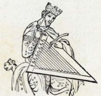
Fig. 5. — De um antigo ms.

Do seculo XV, as notas que pude recolher referem-se principalmente ao uso do salterio na egreja e até o nosso D. Duarte 3 , tratando de regulamentar a sua capella, previne : — . . . «Que os cantores aprendam o salteiro , que quando lhes na mão veher algum beneficio que o saibam, que nom pode seer boo clerigo se nom soaber o salteiro . . . ».