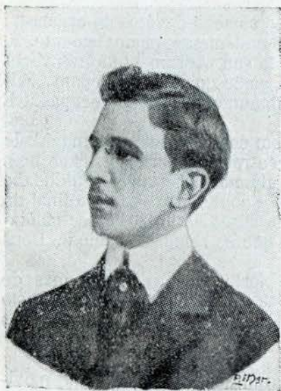
LUIZ DE FREITAS BRANCO

a orientação que deram á sua vida artistica. Victimas do nosso meio, tanto mais nobilitante é o esforço que envidaram, tanto mais digna de elogio a obra que realisaram em opposição ás influencias perniciosas de esse meio. Mas o meio, permittam-me a expressão, acachapa-os, diminue-os, destruiu-lhes grande parte das energias iniciaes. Succede-lhes a elles o mesmo que a nós todos. De mais, as necessidades da vida diaria dispersam-lhes a attenção, não lhes permittem concentrar o esforço mental numa direcção unica. E este perde-se, difunde-se. A obra resulta esporadica, episodica, destituida de intensidade, de profundeza, de calor intimo. Se assim não fôra, se elles tivessem nascido nos grandes paizes, nos paizes avançados, occupariam hoje, pelos seus talentos e pelo seu trabalho, logares eminentes na musica em geral.