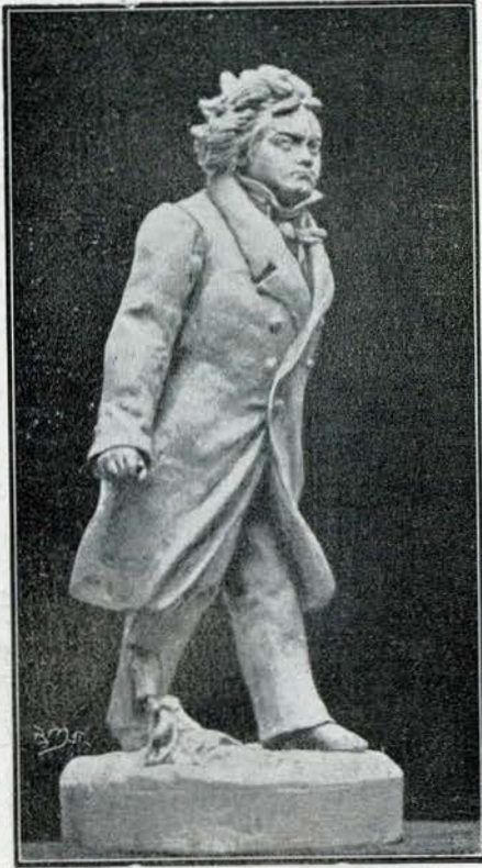
Estatueta de Scheiffer

attitude do homem desiludido dos homens a obra que Beethoven teve de defender contra o espirito do seu tempo. Esta é bem a exteriorisação da admiravel independencia do philosopho, que transferiu a consagração