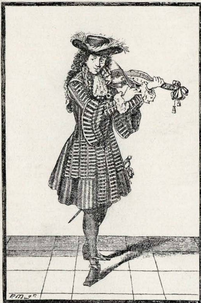
Um dos vinte e quatro violinos do rei

Uma orchestra extravagante, como composição, era a da Grande Ecurie . Em 1768 tinha 12 oboés, haute-contres e tailles de oboé e de violino, baixos tanto de oboé