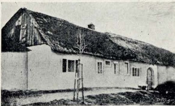
A casa onde nasceu Haydn

cepção e de má vontade; era catholico sincero e devotado aos seus principes, de modo que não conheceu, em epoca alguma da sua vida, o amargo travo dos problemas politicos e philosophicos. Bastava-lhe a sua arte; mas alheando-se por esse modo de toda a especulação extranha, desherdou as suas obras de um elemento que se encontra, na sua mais alta expressão, em Beethoven, e n'um menor grau em Mozart — a paixão, mola real das artes modernas.