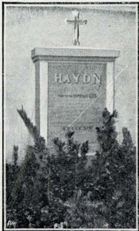
Mausoleu de Haydn, em Vienna

chi, de Napoles, ha um trio duplo, com curiosos effectos d'echo e com um não menos curioso frontespicio, cuja ingenuidade primitiva nos chama logo a attenção — um grupo de musicos com as suas estantes sobre uma collina, e em outra collina menos elevada outro grupo nas mesmas condições. O titulo da peça é textualmente o seguinte: Eco per quatro violini e due violoncelli da eseguirsi in due camere. Ciò è: li due violini e violoncello della prima camera si situeranno ove stà la conversazione, e l'altri in altra camera la più lontana che si possa, avvertendo però, che siano situati in modo che scambievolmente possano vedersi, per andare uniti — del signor Giuseppe Haydn, etc.