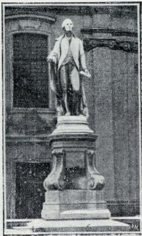
Monumento de Haydn, em Vienna

de se ter divulgado pouco a literatura de Haydn, relativamente á dos outros pontifices da musica classica. Nos centos musicas de acanhada cultura, como o nosso, por exemplo, ainda se ouve de onde em onde um quarteto ou por excepção alguma das outras obras-primas do mestre de Rohrau, mas lá fóra, nas terras de mais desenvolvida educação artistica, onde a anciedade de novidade e os requintes da extravagancia parece quererem absorver e destruir as mais puras joias do passado, é quasi esporadica a apresentação de uma obra d'Haydn, com todas as honras que lhe são devidas.