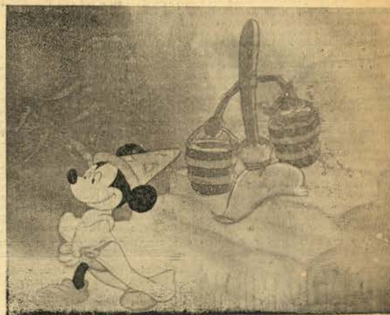
Mickey incarna em «Fantasia» a célebre personagem que Goethe descreve na balada «O Aprendiz de Feiticeiro». Ê-lo fazendo trabalhar por êle uma vassoura, ao som da música de Dukas

A música tem qualquer coisa a dizer a cada um; e cada homem, mulher ou criança ouve uma mensagem diferente, mesmo quando estão a ouvir a mesma música,