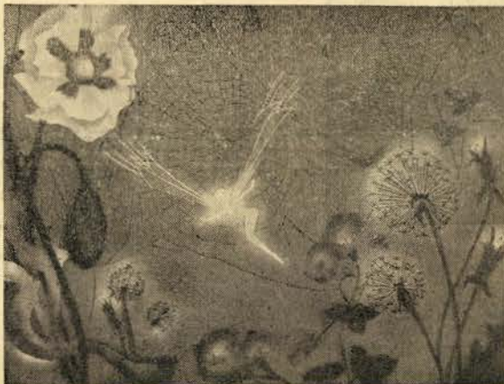
Uma imagem da suite «Casse Noisette» de Tchaikowsky interpretada por Walt Disney. Uma libélula-fada presa numa teia de aranha