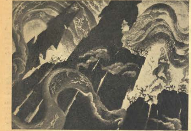
«Uma noite no Monte Calvo» de Mussorgsky inspirou a Disney um aparato «sabbat», em que a variedade decorativa faz perder certa falta de convicção

Momento a momento, em todo o filme, há observações, riqueza de pormenores