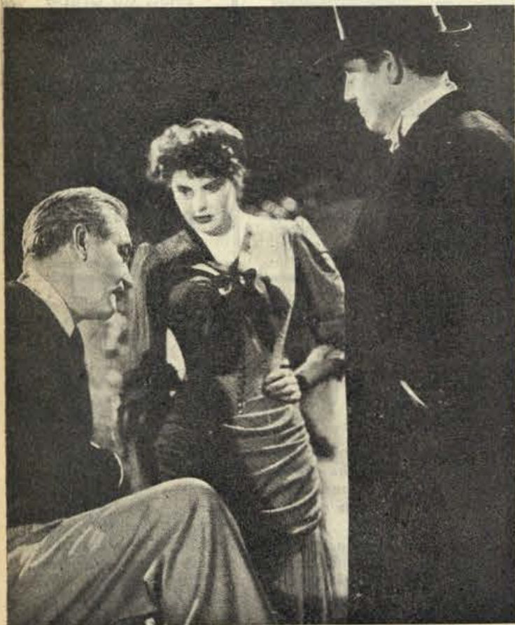
Durante as filmagens de «Dr. Jekyll and Mr. Hyde», o encenador Victor Fleming dá algumas indicações a Spencer Tracy e a Ingrid Bergman.