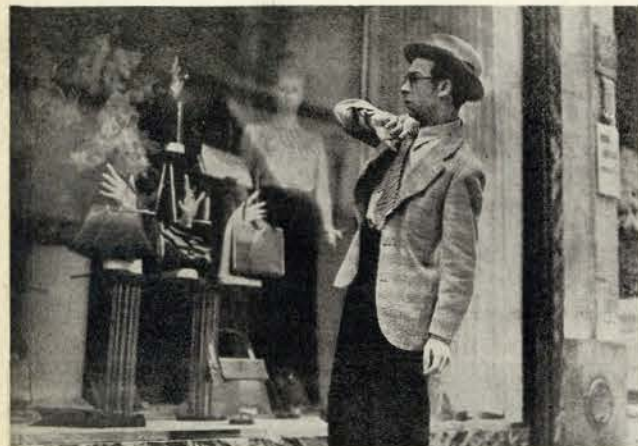
Estará, Ribeirinho, disposto a partir o vidro desta montra?... «O PAI TIRANO» revelar-vos-á, em Setembro, o que o Chico fazia neste momento

Tais palavras fizeram-nos ver com outros olhos o vasto casarão do estúdio da Quinta das Conchas que, apesar dos filmes que de lá têm saído sempre me pareceu não passar do projecto, diga-