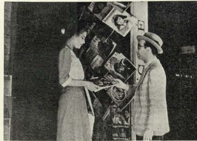
A Tatão conseguiu converter o Chico, furioso dramático, ao cinéfilismo

vistas de Cinema. Iam todos sorridentes e... derretidos ao lado um do outro.