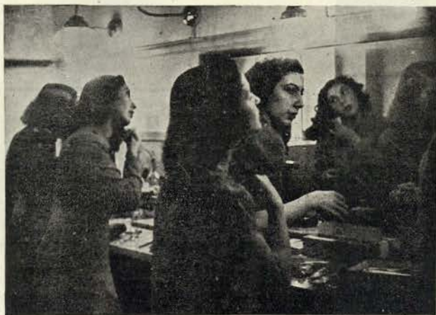
Terminada a maquilhagem, as candidatas ao papel da menina Amélia, cuidam ainda dos penteados. Dois segundos depois, começam as provas de foto e de fonogenia