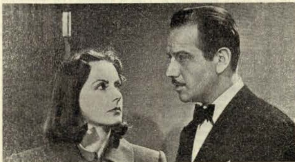
Greta Garbo não costuma trabalhar duas vezes seguidas com o mesmo galã. A excepção aberta com Melvyn Douglas será pura admiração pelo talento do comediante ou mera simpatia pessoal?

Como sucede com todos os filmes de Greta Garbo, poucas coisas têm transpirado acerca do seu novo trabalho, pois nem o título do filme se conhece ainda oficialmente, embora se tenha falado já em «Ana e Anita», que pode muito bem vir a ser o definitivo, pois