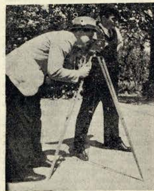
Filma-se uma cena do «Roubo das Pérolas»

Para êste filme que deve estar pronto no fim do próximo mês já se filmaram muitos planos, que nos dizem terem resultado bem.