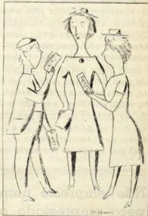
«Cautela com as mulheres»