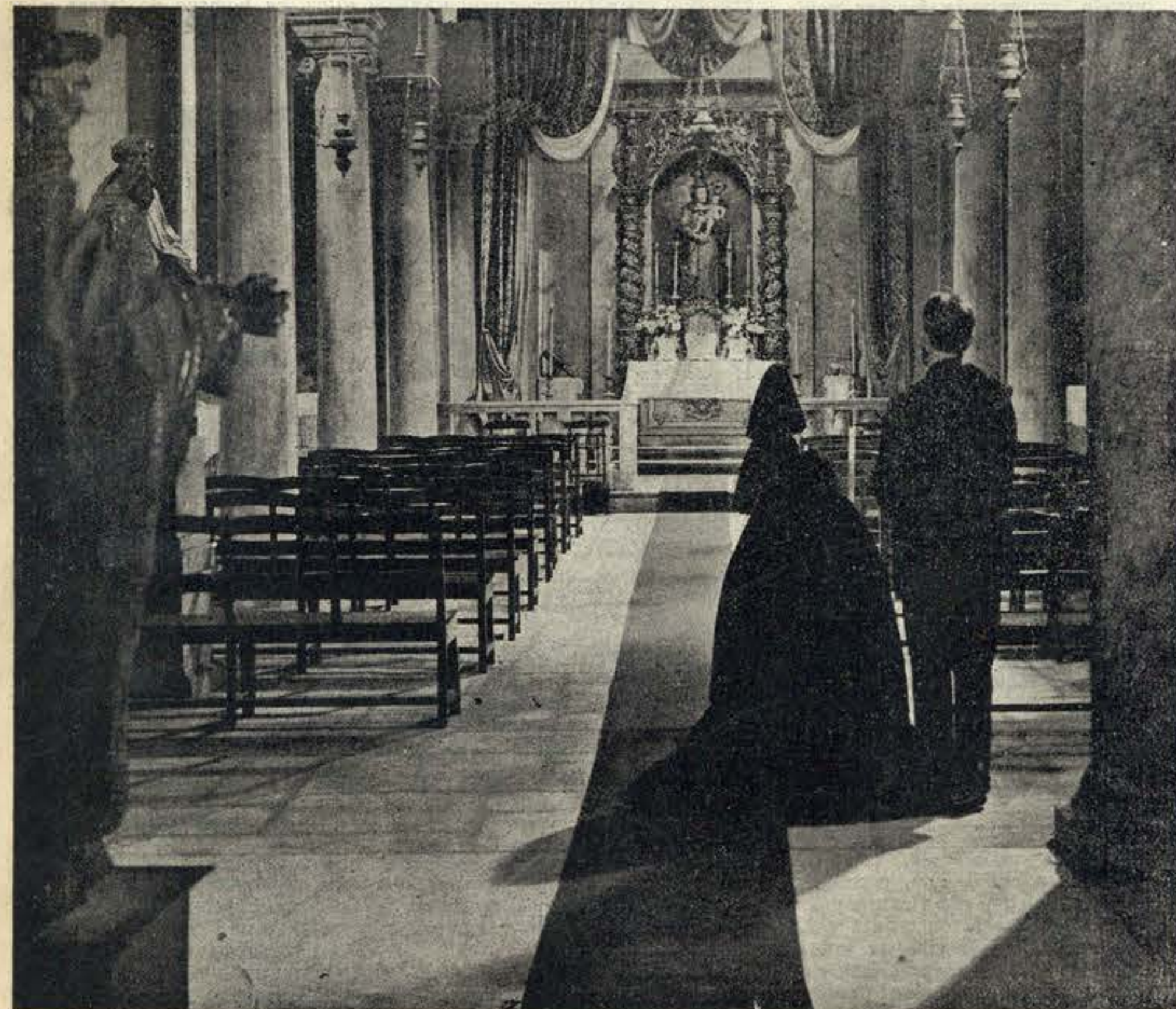
Uma igreja reconstituída no estúdio do Lumiar. Cenário magnífico onde se desenrolam algumas cenas vividas pelos pescadores-actores, cujas interpretações são um prodígio de verdade e de simplicidade

COMPRE, MAS . . . NAO EMPRESTE O «ANIMATOGRAFO»!