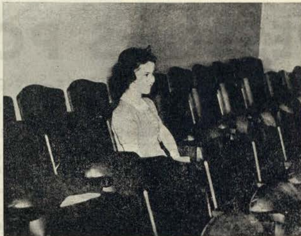
Esta é a mais recente fotografia de Shirley Temple que o «Clipper» nos trouxe de Hollywood

Nestes tempos em que impera o «gás dos nervos», esse perfume fatal que nos envenena pouco a pouco todos os dias, ainda há notícias que dão satisfação. Esta de que Shirley Temple foi ou vai ser afastada dos estúdios é daquelas que me deixam bem disposto. Aquilo era um crime. Entregar-se uma criança de pouca idade à tirania dos directores cinematográficos, que lhe governavam o sorriso, o olhar, a voz, a atitude para expiar emoções e fadigas, que tanto custam aos adultos, era uma aberração do egoísmo industrial com a cumplicidade de progenitores insensatos.