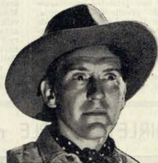
GEORGE (Burgess Meredith)