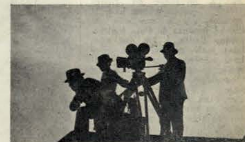
Quando terminaram as filmagens, já era ao pôr do sol. Mas ganhara-se bem o dia!