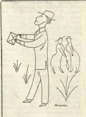
«A Menina da Sorte»

acima de tudo estilo , verdadeiro estilo cinematográfico, comparável aos melhores que nos fornece a antologia do cinema, neste género. Alguns momentos são dignos de antologia, como a cena em que Johnny domina Bates, a saída de Brennan do Tribunal, depois de ter «entregue» o gangster , e outros, vários outros.