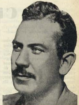
JOHN STEINBECK autor do romance original

Os cinéfilos de há dez anos, exactamente aqueles que podem fazer parte do «Clube do Animatógrafo», não esqueceram de certo a emoção profundíssima que em todos nós provocou a realização cinematográfica de «A Oeste, Nada de Novos». O romance famoso de Erich Maria Remarque, documento prodigioso duma época bem triste, encontrou em Lewis Milestone o encenador perfeito; o artista suficientemente sensível para apreciar em toda a sua subtilidade as reacções psicológicas dos rapazes de 18 anos atirados para a fornalha da guerra (a célebre «Classe 22» de Ludwig