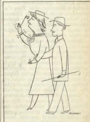
«Mais forte que o amor»