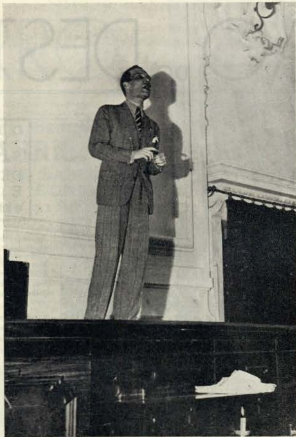
O nosso director no momento de fazer a apresentação do «Clube do Animatógrafo»