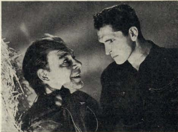
Lon Chaney Júnior e Bob Steele incarnam prodigiosamente as figuras do pobre gigante sem miolos que mata sem querer e a do covarde e ciumento Curley

Mais uma iniciativa do «Animatógrafo» que, à semelhança de tantas outras que assinalam a sua ainda curta mas já bem recheada vida, acaba de passar do domínio dos projectos para o das realidades: a campanha a favor das obras-primas cinematográficas que os nossos exibidores recebem apresentar nas suas salas, por constituírem espectáculo de excepção, considerados «difíceis de defender comercialmente», como soi dizer-se.