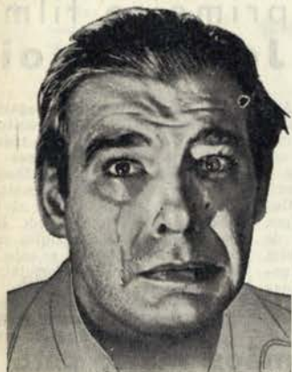
LENNIE (Lon Chaney Jr.)