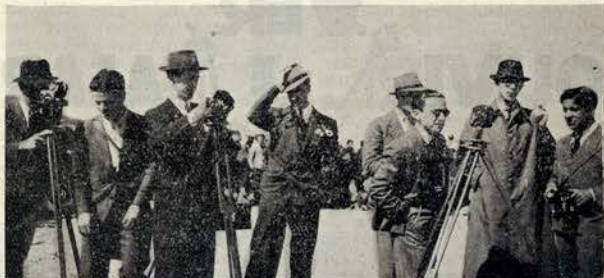
Um friso curioso dos amadores da ADA Filmes e do CONDOR CINE CLUBE durante as filmagens na Póvoa do Varzim

Depois de exibida no Pôrto conta o CLUBE PORTUGUES DE CINEMA DE AMADORES