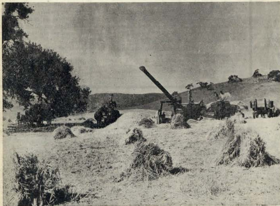
A atmosfera ensolhada do «Middle West» agrícola, em que se crestam os corpos e as almas, foi transportada prodigiosamente para o filme de Milestone

E o filme merece as palmas unânimes do público, como mereceu as quatro estrelas com que o distinguiu a crítica americana.