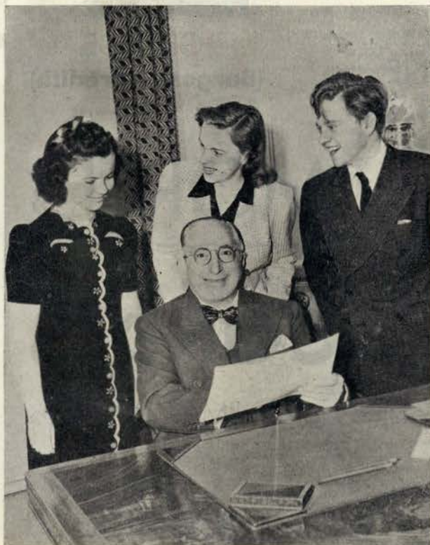
Conforme informámos, Shirley Temple foi contratada pela Metro-Goldwyn Mayer para fazer parte do seu elenco de estrélas. Esta fotografia chegada agora de Hollywood, mostra-nos a pequena grande artista ao lado de Mickey Rooney e de Judy Garland, no momento em que Louis B. Mayer, o director da M-G-M, apresenta a Shirley o contrato para assinar