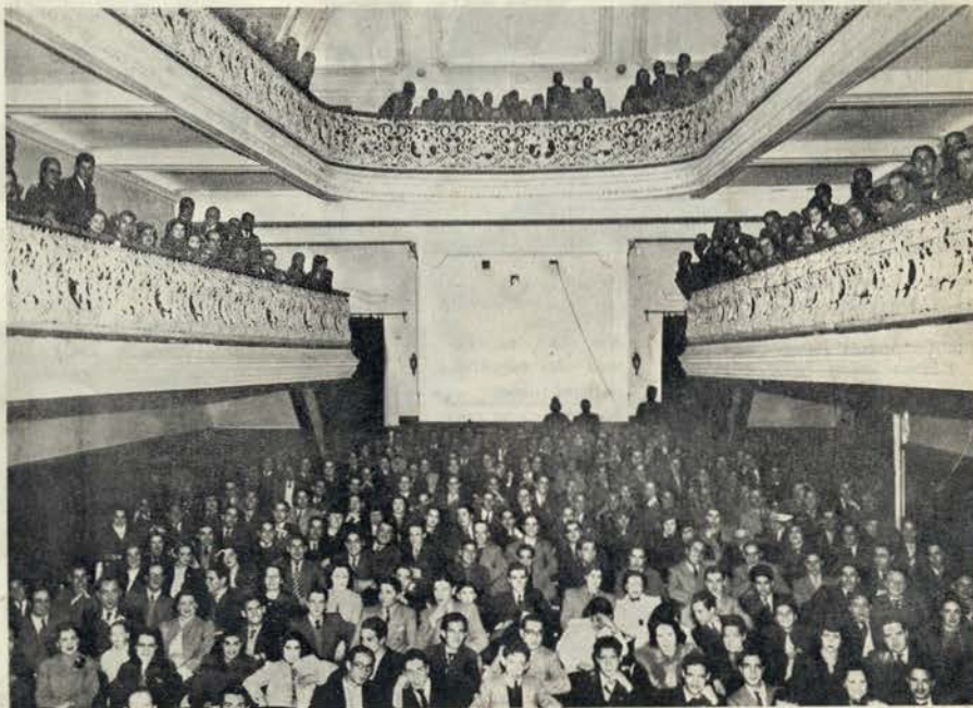
Os sócios do Clube enchem, como se vê, o elegante cinema do Palácio da Exposição

Podemos hoje informar os sócios que, o «Clube do Animatógrafo» conseguiu já obter outra reliquia do cinema silencioso para apresentar na primeira ocasião. Trata-se nem mais nem menos, do que do primeiro filme de Greta Garbo — a inesquecível «Lenda de Gösta Berling».