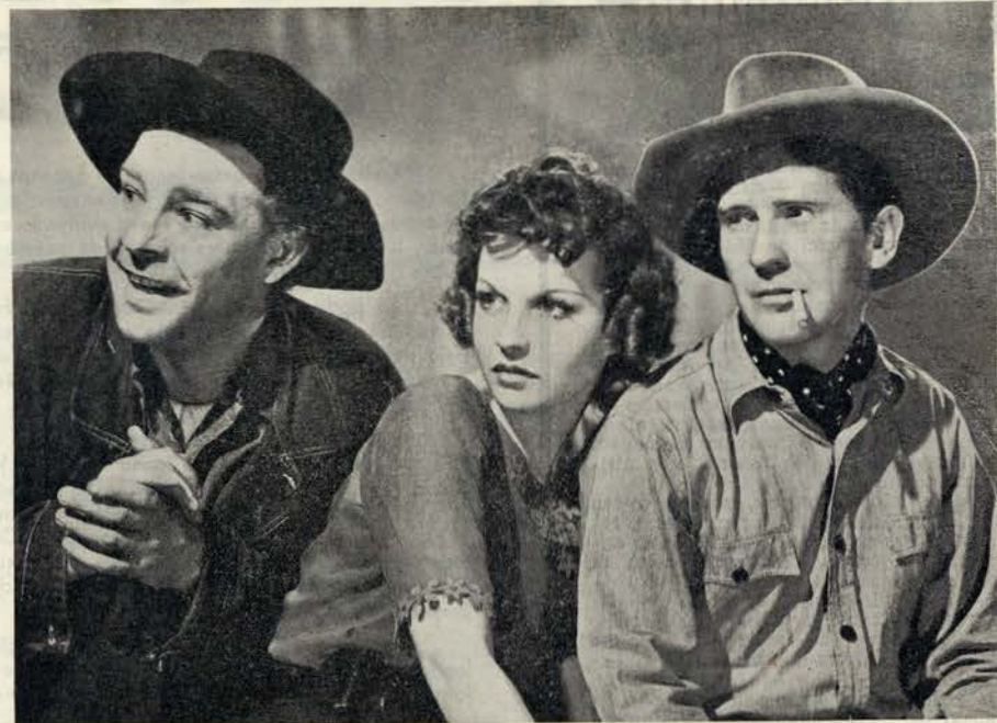
O assombroso terceto principal dum filme em que cada intérprete é um grande artista

George e Lennie tinham óptimos projectos: queriam juntar o dinheiro bastante para comprar uma quinta, onde houvesse um moinho, e terras de lavoura, e pombos, e coelhos, muitos coelhos, de que Lennie trataria com desvelo.