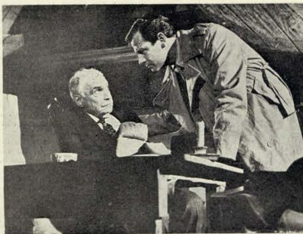
Uma cena estranha com Joel Mc Crea

Produtor — Walter Wanger Realizador — Alfred Hitchcock Argumento — Charles Bennet e Joan Harrison