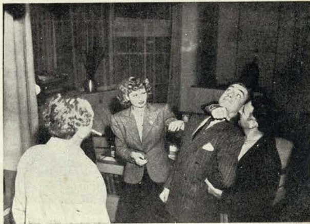
Richard Talmadge demonstra a Lucille Ball como deve defender-se de Edmund O'Brien. O director Richard Wallace assiste à demonstração. Trata-se dum «gag» para o filme produzido por Harold Lloyd para a RKO-Radio