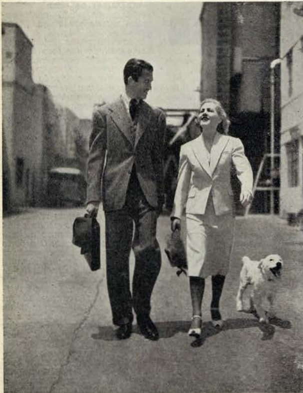
Não deixem de ver as excepcionais interpretações de JAMES STEWART e JEAN ARTHUR