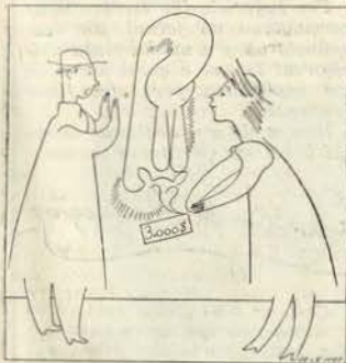
Não, não, Nanette