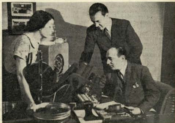
Um dos principais colaboradores de Leonide Moguy é o seu assistente. Conhecem-no? Trata-se nem mais, nem menos, do que do filho da marchala Pitain, esposa do Chefe do Estado francês