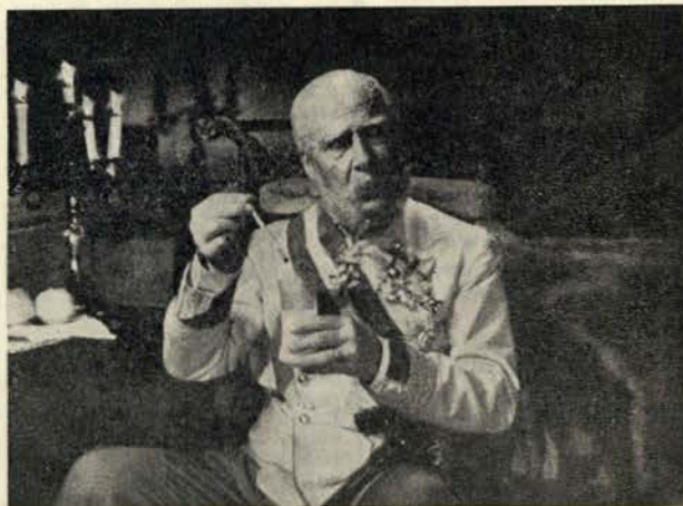
Outra figura histórica que aparece no filme: o imperador Francisco José de Austria, tal como o representam os retratos da época