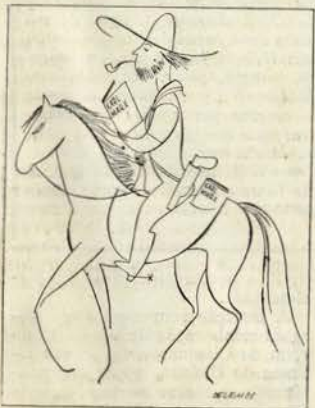
Os Marx no Far West