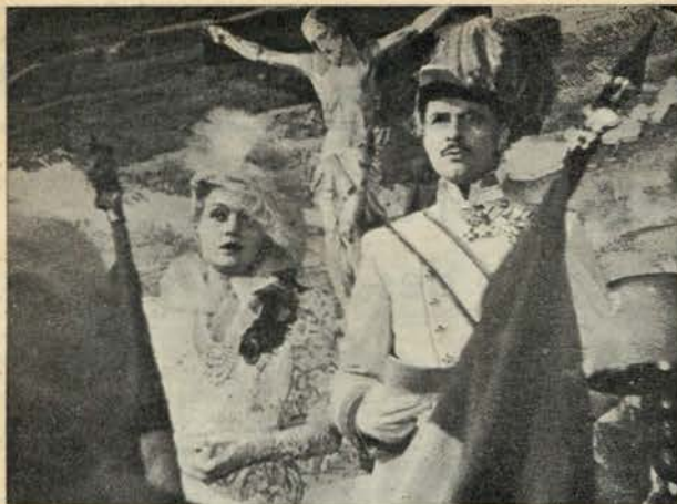
Pouco antes do atentado que provocou a Grande Guerra. O arquiduque Fernando e sua mulher caminham para a morte, em Serajevo

Mayerling ficou na história e na tradição como um dos mais densos e curiosos mistérios da vida contemporânea. O drama, cujo epílogo sangrento anda na memória de todos e foi já recordado no cinema com Charles Boyer e Danielle Darrieux nos protagonistas, teve numerosas explicações e justificações, qual delas a mais lógica e também a mais problemática. Saber-se o que pertencia a duas almas é tarefa demasiada para os mortais. O drama de Mayerling — talvez apenas de carácter íntimo — teve o condão de contender com problemas políticos, que foram violentamente abalados.