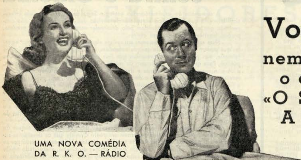
UMA NOVA COMÉDIA DA R. K. O. — RÁDIO