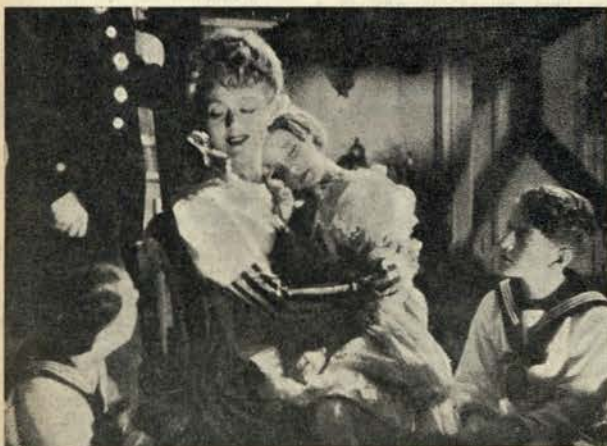
Edwige Feuilléré, a grande actriz francesa, tem na arquiduquesa uma das suas interpretações mais notáveis