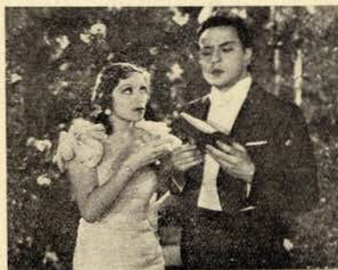
«El último hombre en la tierra» de JAMES TINLING

Era esplêndida a ideia do filme. Prestava-se para coisas engraçadíssimas. Mas não tiveram imaginação nem fantasia para a tratar. A dificuldade seria meter na metragem habitual tudo quanto uma imaginação mediana inventasse de pitoresco. Afinal entreteram-se a gastar metros e metros com cenas de bebedeiras inúteis e banais. A espaços criaram coisas engraçadas, mas oi porque não podia deixar de ser. Nunca souberam tirar partido das situações picarescas provocadas pelo argumento. O congresso internacional podia ser uma coisa fabulosa. O mundo só habitado por mulheres prestava-se para mil e um apontamentos saborosos. Entim, mais uma ideia excelente mal aproveitada.