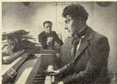
(Moi et l'Imperatrie) de FRIEDERICH HOLLANDER

A Imperatriz e Eu vem alinhar-se na primeira fila das obras de Eric Pommer, ao lado do Caminho do Paraíso e do Congresso que dança.