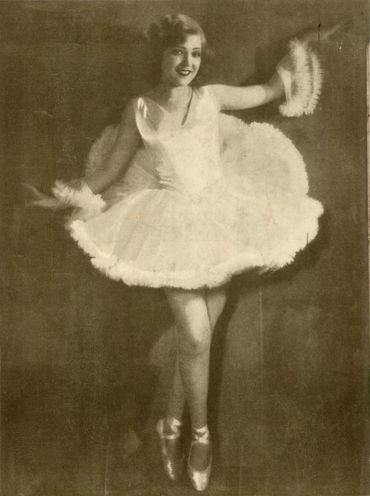
MARtha EGGERTh CAIU NA BOA GRAÇA DO PÚBLICO PORTUGUÊS DESDE A SUA APARIÇÃO EM «UMA CANÇÃO, UM BEIJO, UMA MULHER». MEMOS VOLTAR A VÊ-LA NUMA OPEETA DELICIOSA — DIPLOMATA PARA SENHORAS — AO LADO DE MAX HANSEN E DE LEO SLE...