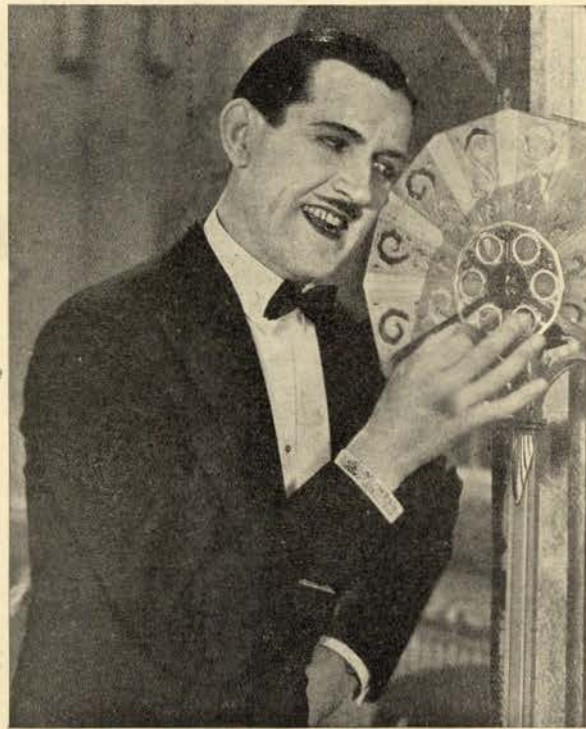
O sorriso inconfundível de Charlie Chase

Calcule-se quanto é preciso de talento para se fazer rir os semelhantes sem recorrer a qualquer expediente grosseiro ou subtil, a qualquer baixeza ou refinamento.