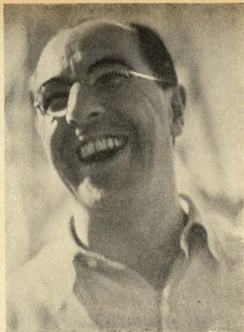
O riso claro e contagioso de Pabst

Vocês naturalmente também supõem como o material Sancho Pansa que se trata dum simpático rebanho de carneiros. Pobres criaturas de razão clara e de olhos abertos que vós sois! — aquele turbilhão de preira, reparem, esconde efectivamente um exército de gigantes. São terríveis e seus aqueles gigantes D. Quixote é um homem generoso que percorre o mundo para defender a humanidade. Qualquer hesitação é uma cobardia. Avante pois, á carga sobre os pérfidos gigantes. E D. Quixote avança, a galope no seu cavalo espectral, e corajosamente, violentamente, desbarata o exército. Depois, con-