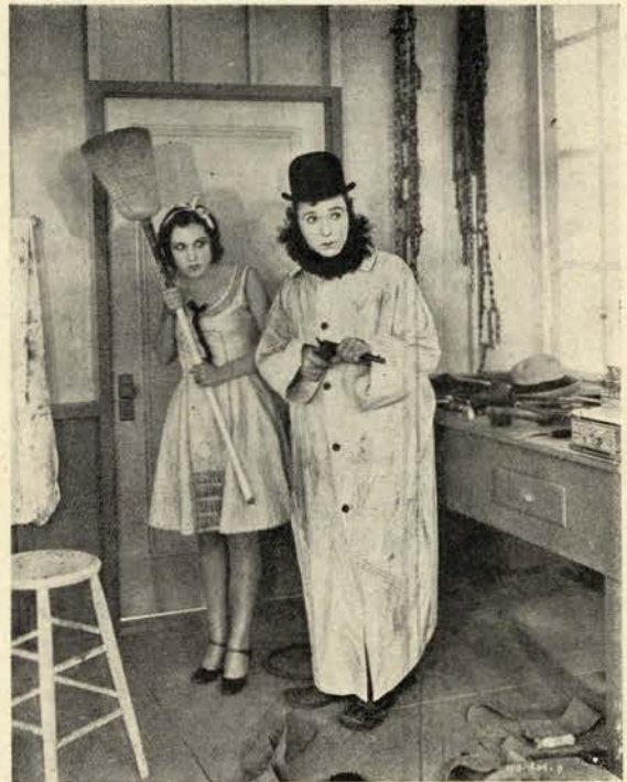
A maneira de Langdon é inconfundível