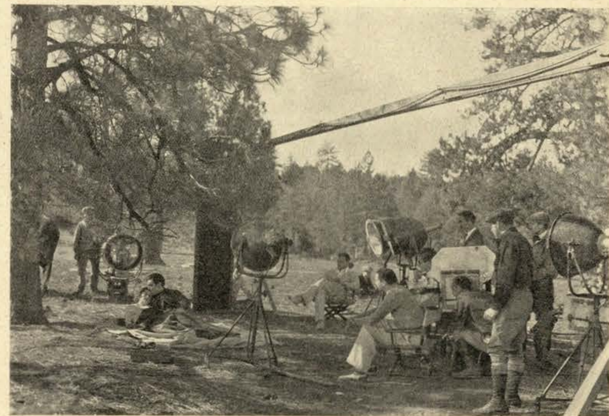
Malcolm Saint-Clair dirigindo Joan Crawford e John Mack Brown numa cena exterior de «O coração manda» (Montana Moon), sob o olhar competente de Douglas Fairbanks Junior, que até lá ainda era casado com Joan