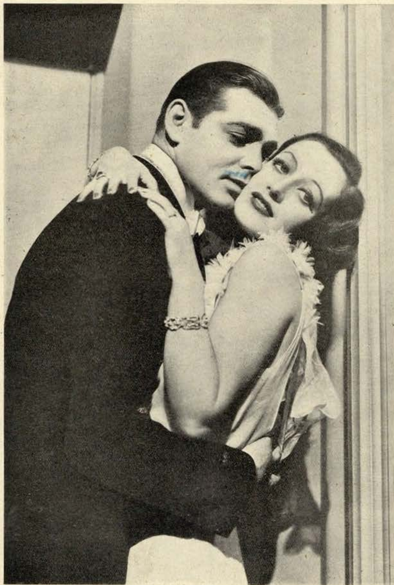
A silhueta máscula de Gable é o complemento directo da beleza pujante de Joan Crawford

Vieram depois Polly of the Circus com Ma-