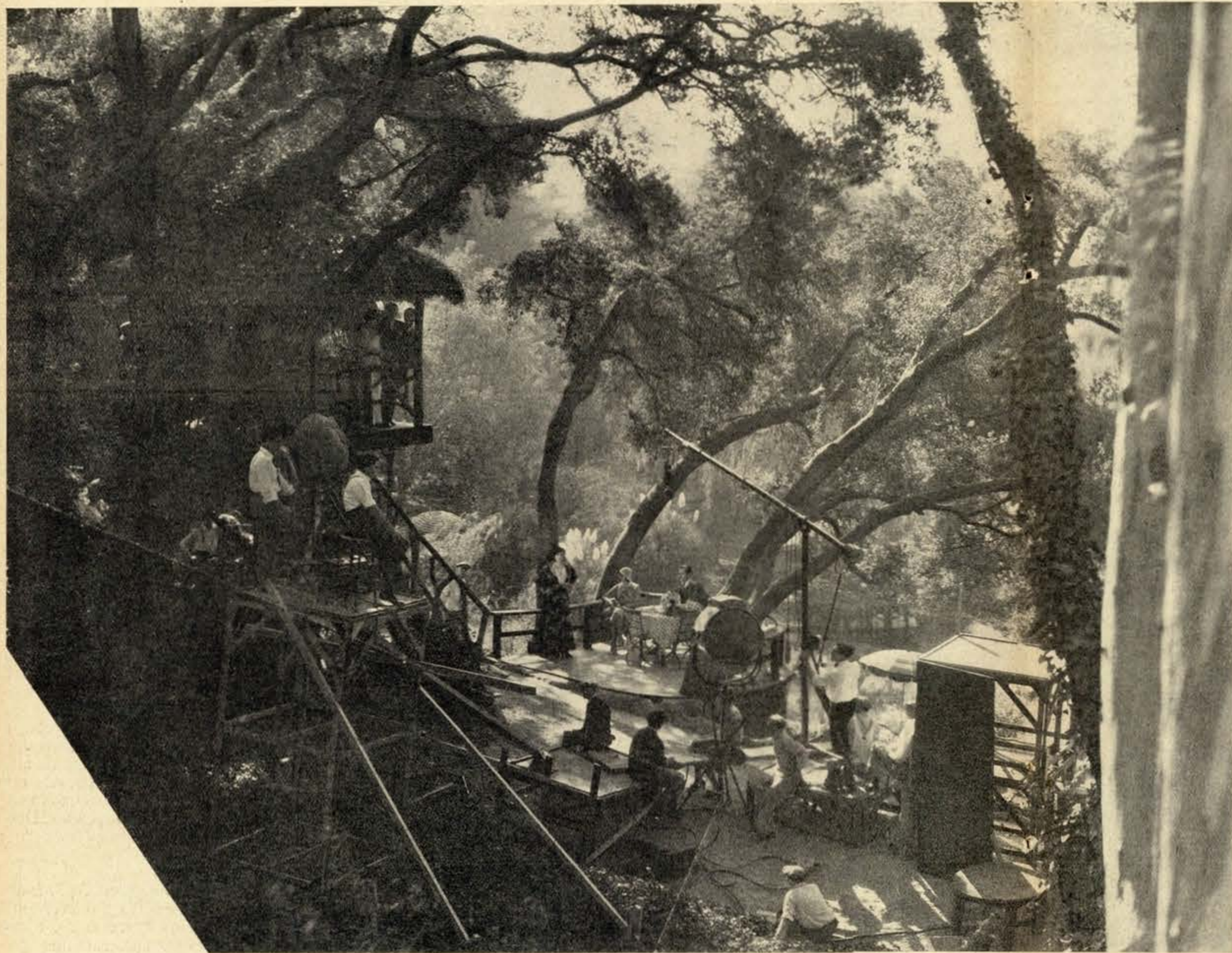
Imagem tomada de exteriores, durante a execução dum filme de Clarence Brown, em que figuram Greta Garbo e Robert Montgomery

cinema deve ser, movimento e da acção. Mas em fechar-se o recê de de- que cons- iardins, ou o duas