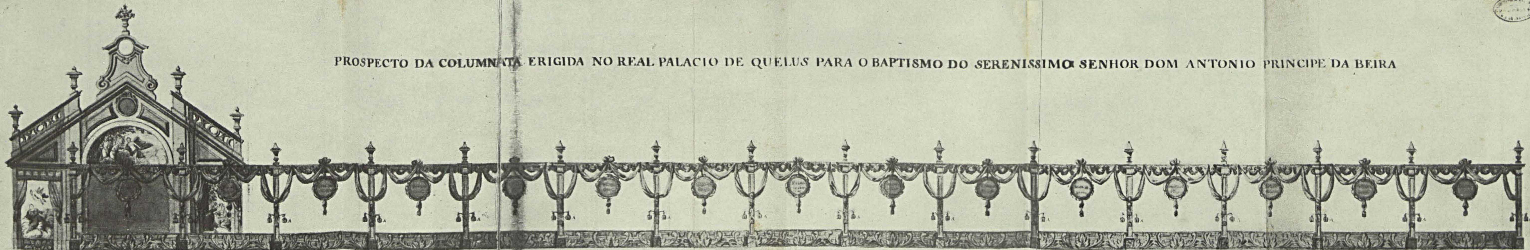
AAA. Iluminação de Serpentina de quatro limes com que se ornou toda a Columnata.